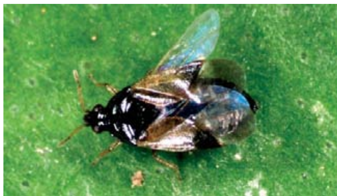
Foto 3. Rodolia cardinalis , depredador específico de la cochinilla acanalada ( Icerya purchasi ). Foto 4. Orius laevigatus , depredador omnívoro, que controla trips ( Frankliniella occidentalis ), pero que se puede alimentar sobre polen o, mediante competencia intergremial, sobre Amblyseius swirskii .