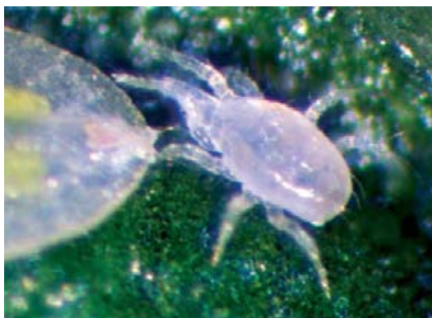
Foto 1. Larvas del minador del tomate, Tuta absoluta , penetrando en la mina en hoja de tomate. Foto 2. El ácaro depredador, Amblyseius swirskii , depredando una ninfa de mosca blanca. ( Bemisia tabaci ).