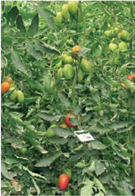
Foto 7. Dispensador empleado en la lucha biológica para aumentar el número de enemigos naturales.

establecerse, en parte, alimentándose sobre el segundo depredador) (foto 4).