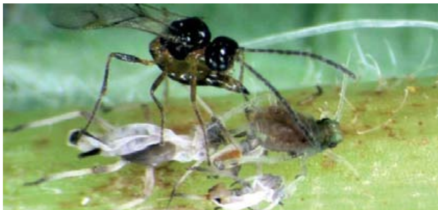
Foto 5. Sistema de aplicación de la lucha biológica en invernaderos, mediante el empleo de plantas reservorio. Foto 6. Aphidius colemani , parasitando un pulgón. Enemigo natural empleado en el sistema de plantas reservorio y huésped alternativo.