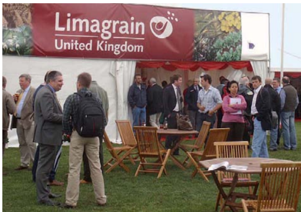
Stand al aire libre de Limagrain United Kingdom en la feria agrícola anual Cereals Event (Boothby Graffoe, Lincolnshire).

Por otro lado la estrategia de internacionalización del grupo se ha concretado en la reciente creación de tres nuevas BUs. En 2010, junto a Arcadia Biosciences, se creó en Estados Unidos Limagrain Cereal Seeds, empresa de mejora de trigo de ámbito mundial. Ese mismo año también empezaron su actividad en el sector de semillas de cultivos extensivos, concretamente en trigo y maíz, Limagrain South America con filiales en Argentina y Brasil, y Limagrain Asia