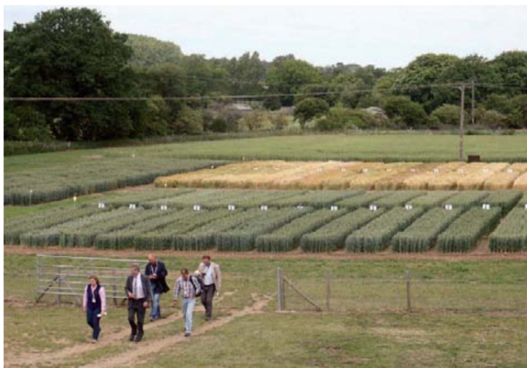
Parcelas demostrativas de variedades de trigo y cebada en la Estación de Mejora de Trigo de Woolpit (Suffolk, Reino Unido), perteneciente a la filial de Limagrain United Kingdom.

En la actualidad Vilmorin & Cie ocupa el cuarto puesto en el ranking del sector (segundo en