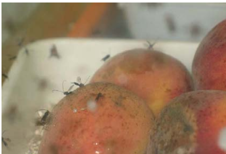
Foto 8. Ensayo de laboratorio, con adultos de F. arisanus sobre melocotón.

Posteriormente se realizaron ensayos de semi-campo (alguno de ellos también en melocotonero), entendiéndose por tales los efectuados en invernadero, así como en campo, sobre árboles con ramas embolsadas, que mantenían el confinamiento de los parasitoides. En ambas situaciones, se realizaba en principio la suelta de adultos de mosca procedentes de una cría de laboratorio para infestar la fruta, y posteriormente se introducían (en la cabina del invernadero o en la malla del árbol) los adultos de los parasitoides, también procedentes de la cría de laboratorio (fotos 9, 10 y 11). En esta situación de semi-campo, ambas especies demostraron su capacidad en parasitar larvas de mosca en melocotón, con una tasa de parasitismo variable, pero que rondaba el 10%.