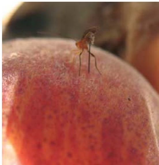
Foto 12. Ensayo de campo. Hembra de D. tryoni parasitando una larva de C. capitata en melocotón.