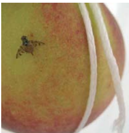
Foto 9. Ensayo de semi-campo (invernadero). Hembra de C. capitata .

Podemos considerar que esta tasa de parasitismo es muy interesante a la hora de determinar el interés por este método de control de la plaga, sobre todo teniendo en cuenta que se obtenía sin tener ajustada la dosis de suel-