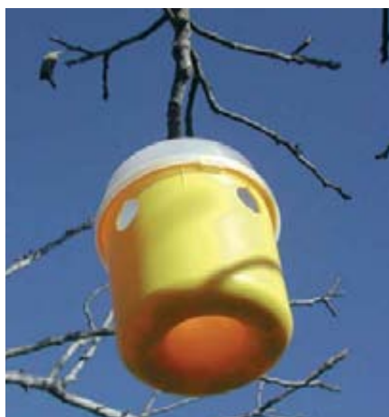
Foto 3. Trampa Tephri-trap.

Por otra parte, actualmente la protección fitosanitaria contra esta plaga, al igual que las de otros agentes nocivos, se enfoca hacia la Ges-