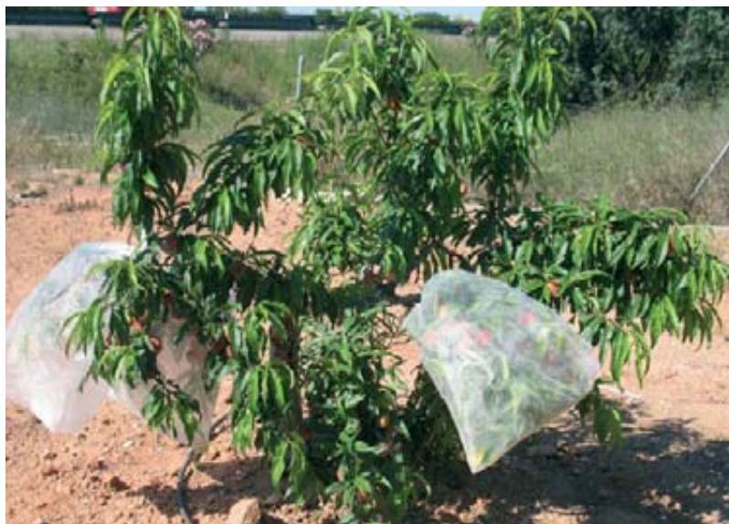
Foto 11. Ensayo de semi-campo (parcela de melocotón). Ramas embolsadas con adultos de D. tryoni parasitando larvas de C. capitata en melocotón.

En el IVIA ya se inició una cría de esta especie, a finales del año 2008, con ejemplares procedentes del INIA de Madrid, en donde se mantenía este insecto en cría controlada (cría que ya ha sido eliminada) durante varios años. Además, a mediados de 2009 se importó esta misma especie desde la Planta de Cría y Esterilización de mosca de la fruta y parasitoides (Moscafrut) en Metapa de Domínguez (Méjico). En definitiva, durante los dos últimos años, en la Unidad de Entomología del IVIA se ha trabajado comparando las dos especies de