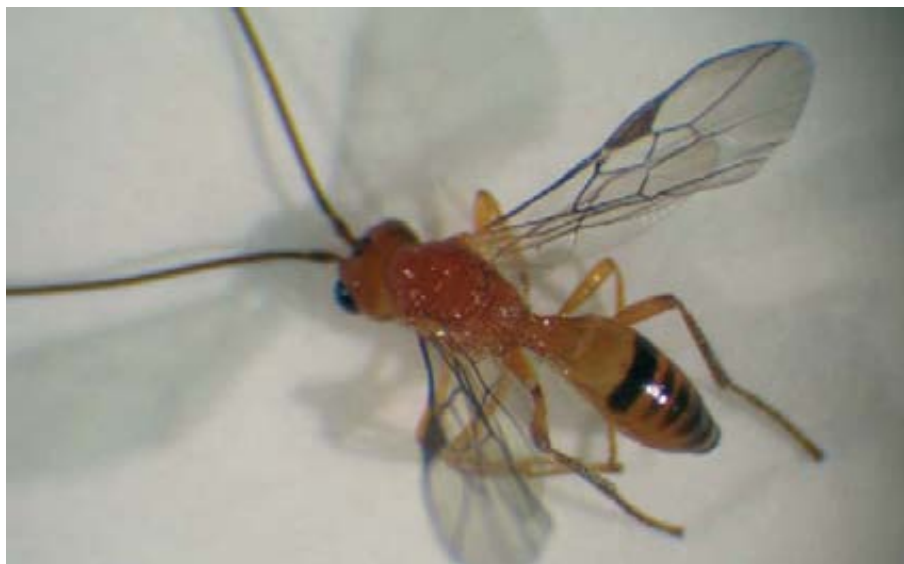
Foto 13. Macho de Diachasmimorpha longicaudata .