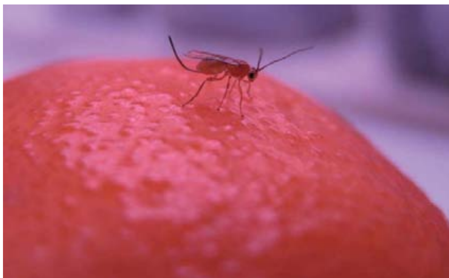
Foto 14. Hembra de D. longicaudata sobre fruto de cítrico.

parasitoides de larvas y se ha confirmado que es D. longicaudata quien puede ser más efectiva en un posible control de C. capitata , por su mayor capacidad parasitaria y adaptabilidad a las condiciones climáticas de la Comunidad Valenciana.