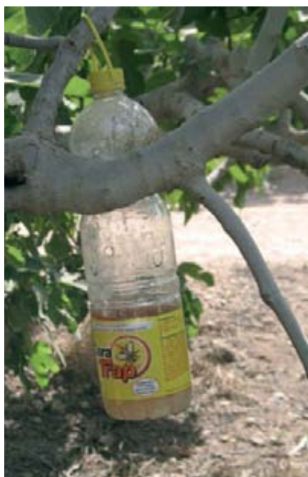
Foto 4. Trampa Cera Trap.

Este sistema, cuyo único producto comercializado actualmente es el denominado Adress (Syngenta Agro), consiste en conseguir la atracción de las moscas por medio de atrayentes y que éstas ingieran los cebos proteicos que contienen el quimioesterilizante (foto 5). El producto utilizado (lufenuron al 3%) es un inhibidor de la síntesis de quitina, que a dosis más elevadas es letal para el insecto pero que, en esta situación, las moscas que han ingerido este cebo quedan estériles y, lo que es más importante, transmiten la esterilidad en las sucesivas cópulas; así cada mosca se convierte en una trampa móvil transmisora de la esterilidad, lo que permite afectar a una gran proporción de la población establecida de mosca. Además, este método de control tiene resultados acumulativos, lo que quiere decir que su rendimiento óptimo se consigue tras varias campañas de tratamiento. Las trampas deben colocarse antes de la primera generación,