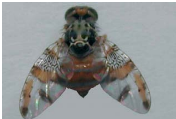
Foto 1 (izquierda). Macho de C. Capitata . Foto 2 (derecha). Hembra de C. capitata .