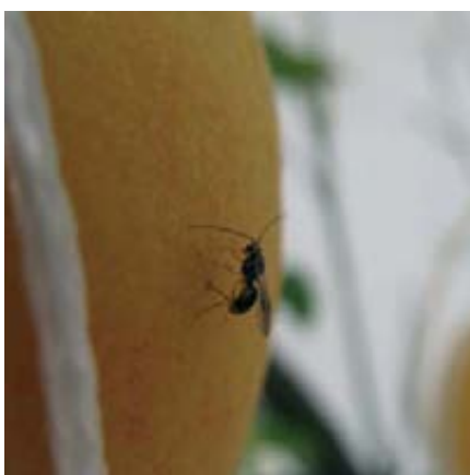
Foto 10. Ensayo de semi-campo (invernadero). Hembra de F. arisanus parasitando un huevo de C. capitata en melocotón.

ta, es decir, el número de individuos a soltar, ya sea por superficie o por volumen de infestación de la mosca.