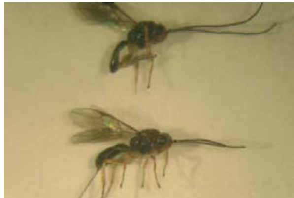
Foto 6. Adultos (macho izquierda y hembra derecha) del himenóptero parasitoide Diachasmimorpha tryoni . Foto 7. Adultos (macho arriba y hembra abajo) del himenóptero parasitoide Fopius arisanus .

ral Research Center (USDA-ARS) en Hawai (EE.UU.), Fopius arisanus y Diachasmimorpha tryoni (fotos 6 y 7).