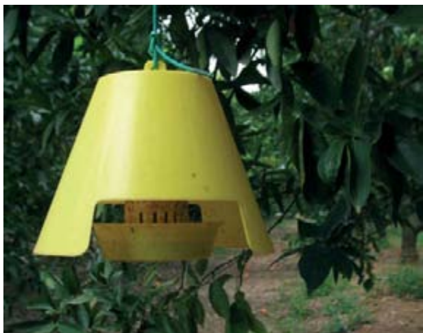
Foto 5. Trampa quimioesterilizante Adress.

La Unidad Asociada de Entomología IVIA-CIB/CSIC inició la puesta en marcha de un programa de control biológico clásico, con la introducción en nuestro país, a finales del año 2002, de dos parasitoides exóticos procedentes del U.S. Pacific Basin Agricultu-