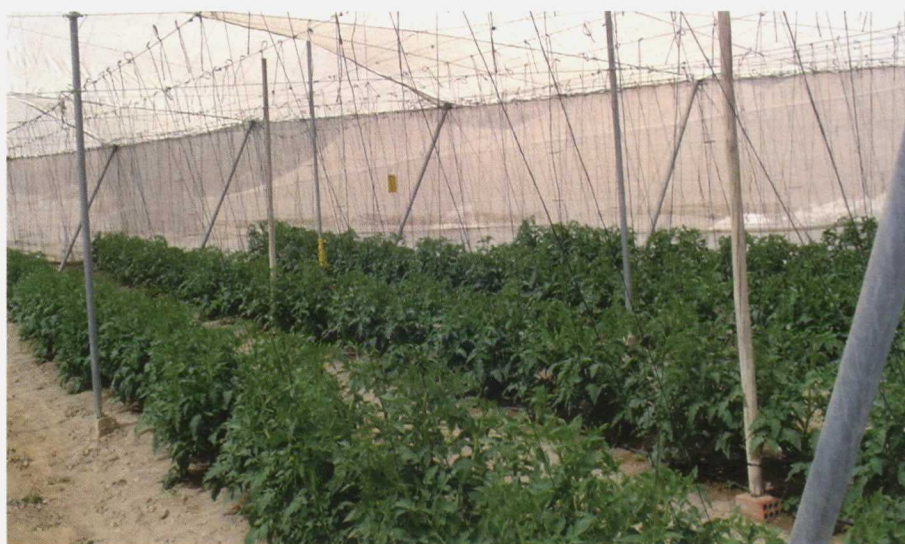
Invernadero de Tipo 2, un parral mejorado con estructura metálica y cultivo en suelo.

Los costes totales, en euros por metro cuadrado de invernadero, oscilan entre 5,94 €/m 2 para el Tipo-1 y 11,19 €/m 2 para el Tipo-4, lo que supone una diferencia muy significativa