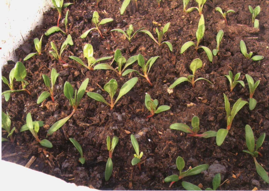
Semillero de variedades ecológicas.