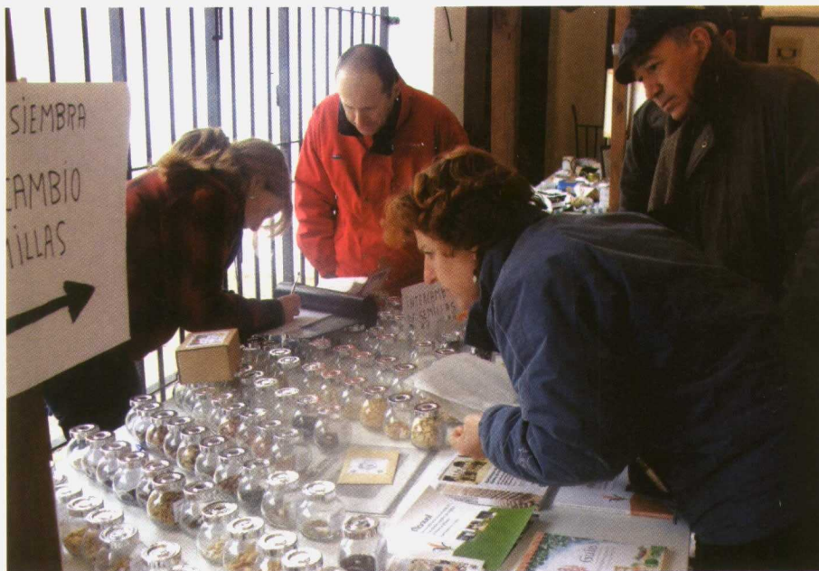
Muestra de semillas de variedades tradicionales de producción ecológica.

Para cada variedad inscrita y para cada proveedor, la base de datos mencionada en el artículo 48 contendrá al menos la siguiente información: