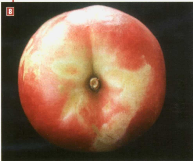
Foto 8. Daños de Frankliniella.

ción, para poder establecer en cada momento si es necesario o no la realización de una aplicación a base de fitosanitarios de cara a mantener la plaga bajo niveles aceptables. En el caso de mosca mediterránea de la fruta, el uso de los métodos alternativos se acompaña de recuento periódico de capturas en trampa, para conocer el nivel de vuelo de la plantación, y también se realiza recuento de frutos, para determinar el porcentaje de frutos atacados. En el caso de que estos parámetros superen determinados umbrales preestablecidos, será el momento de utilizar alternativas más contundentes basadas en la utilización de productos químicos de síntesis.