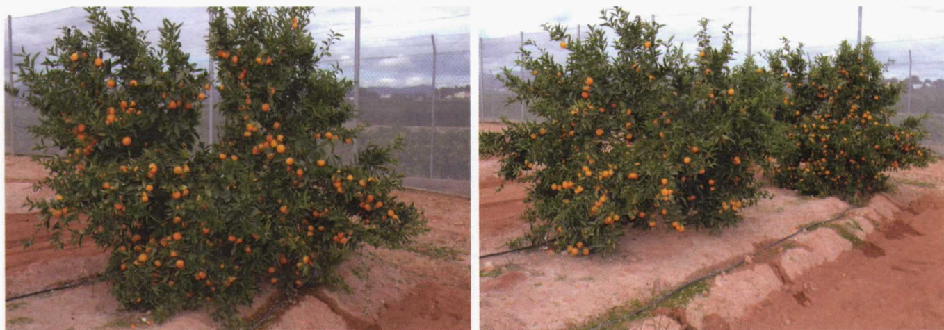
Foto izquierda: Forner-Alcaide nº 31, patrón muy productivo que presenta fruta de excelente calidad. Tolerante al virus de la tristeza, buena tolerancia a caliza y a salinidad. Es muy resistente a nematodos. Foto derecha: Forner-Alcaide nº 13, híbrido de mandarino Cleopatra x Poncirus trifoliata . Aunque tiene una sensibilidad a la caliza similar al citrange Carrizo, posee una excelente tolerancia a la salinidad y al encharcamiento y es resistente a tristeza.

Híbrido de mandarino Cleopatra x Poncirus trifoliata , resistente a caliza y salinidad. Presenta una buena productividad y calidad de fruta. Tolerante al virus de la tristeza. Muy resistente a