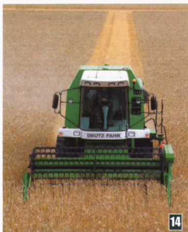
Fotos 13 y 14. Vista frontal de una cosechadora trabajando con un sistema de autoguiado. El corte está "lleno" con la última pasada de la parcela.