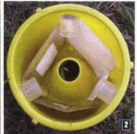
Fotos 1, 2 y 3. Trampa y difusores de atrayentes. 1) Exterior de la trampa Maxitrap, 2) Interior de la trampa mostrando los tubos y los atrayentes, 3) Difusor único de membrana de los tres atrayentes alimenticios Ferag CC D TM.