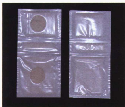
Foto 4. Difusor único de membrana de los tres atrayentes alimenticios Biolure Unipack.

Durante el año 2008, el nivel poblacional aumentó rápidamente en la primera parte de la campaña, constituyendo una fuerte amenaza para los melocotones, lo que obligó en algunas parcelas a reforzar el sistema de captura masiva con algún tratamiento insecticida; a diferencia de los otros tres años, en los que prácticamente no se utilizaron. En el cuadro I puede observarse tanto para melocotones como para nectarinas, el nivel de daño registrado y el número de aplicaciones realizadas en las variedades tardías de ambos. Se puede ver, que a pesar del nivel poblacional registrado, los daños fueron muy bajos.