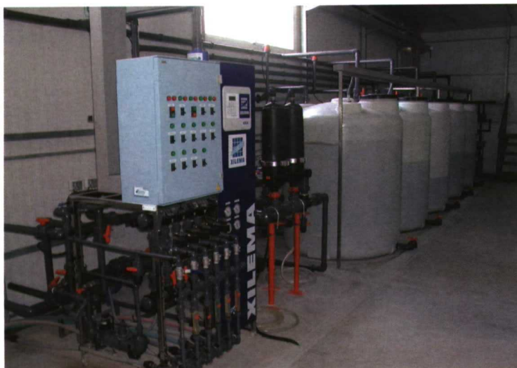
Foto 1. Equipo de fertirrigación.

una mejor solubilidad. También se controla la conductividad eléctrica (CE), que es proporcional a la concentración de la disolución nutritiva en la que se incluyen los fertilizantes. Tanto la CE como el pH se miden por medio de sensores electrónicos, al igual que la temperatura del agua, que es necesaria para corregir el valor de la conductividad. En determinadas zonas es necesario instalar desaladoras en las explotaciones, debido a la mala calidad del agua y a la excesiva salinidad. Generalmente son instalaciones de ósmosis inversa, que depuran el agua y posteriormente la mezclan (desalada con la procedente del sondeo sin tratar) antes de incorporarla al sistema de riego.