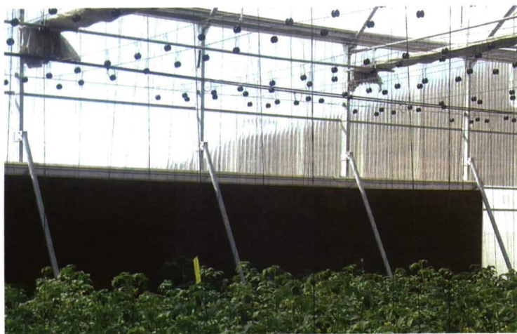
Foto 6. Paneles evaporadores.

diciones de alto consumo (dosel cerrado, alta radiación y baja renovación de aire) puede llegar a ser la mitad que en el exterior (350 ppm), por lo que se utilizan sistemas para incrementar la concentración del citado gas en el interior de los invernaderos. El enriquecimiento carbónico mediante la incorporación de CO 2 puro es el procedimiento más utilizado y la fuente más controlable de incorporación de dióxido de carbono. El equipo necesario consta principalmente de un depósito (foto 7) donde se almacena el CO 2 en estado líquido, un conjunto de vasos de expansión donde el líquido se transforma a su estado gaseoso por medio de una disminución de presión, un sistema de tuberías primarias y las tuberías de distribución junto al cultivo. Las tuberías pueden ser tanto cintas de riego con goteros insertados de 1 l/h o mediante mangas flexibles de polietileno transparente. Estas tuberías se ramifican por todo el invernadero distribuyendo el gas en la base de las plantas.