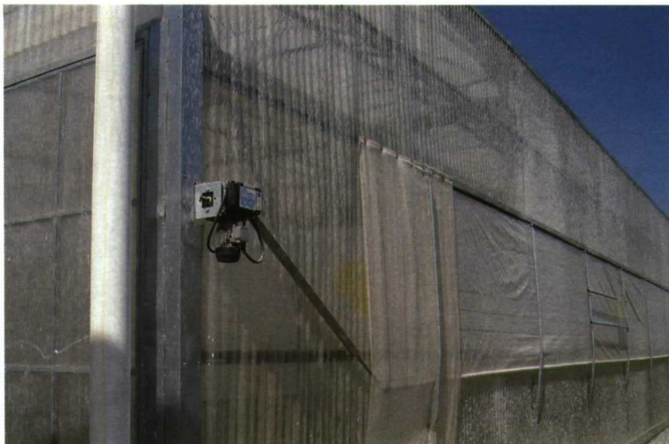
Foto 4. Ventana lateral automatizada.