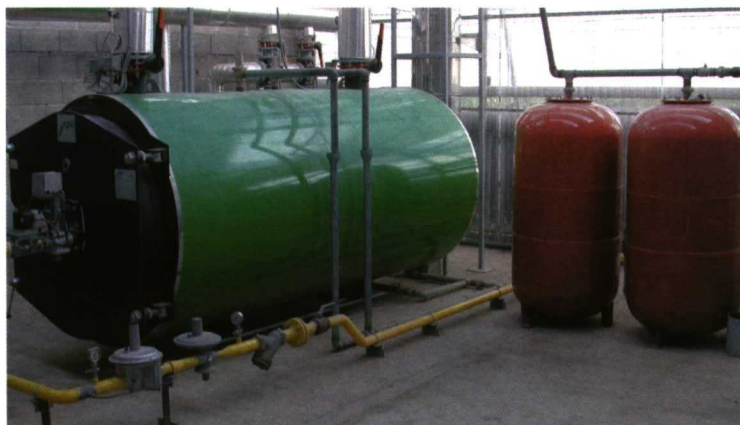
Foto 5. Caldera.

hora de incorporar un sistema de control climático en un invernadero, es saber cuál de ellos es más conveniente. Esto depende de múltiples factores interrelacionados que delimitan el sistema o incluso el equipo más aconsejable en cada caso. Así, la estructura del invernadero, los cultivos y variedades utilizadas, los periodos de producción y el sistema de comercialización con el que se trabaja, son elementos que hay que considerar a la hora de evaluar la incorporación de tecnología.