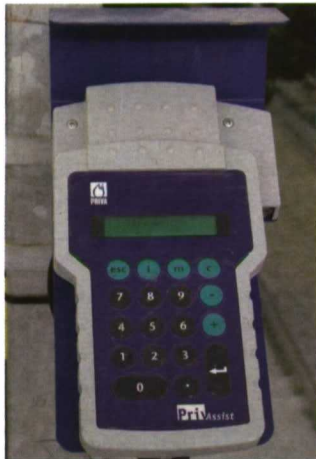
Foto 3. Control del trabajo de los operarios.

En algunas explotaciones con mayor nivel de tecnificación, también se instalan sistemas de almacenamiento de datos electrónicos ( foto 3 ) en los que los operarios deben introducir los correspondientes a las calles o filas de plantas en las que han trabajado, al tipo de labor realizada, y su código de operario; de forma que esta información se puede recoger en un ordenador personal para poder controlar todas las labores que se llevan a cabo en el invernadero, a la vez que poder realizar el tratamiento estadístico de los datos para la evaluación del rendimiento de cada trabajador. Estos dispositivos permiten establecer políticas de incentivos a los operarios.