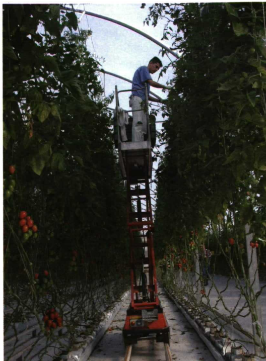
Foto 2. Plataforma móvil elevadora.

tractor ha dado paso a una serie de máquinas más propias de las industrias que del campo, como son las traspaletas y las carretillas elevadoras, que permiten un transporte rápido y cómodo de los palets. Esto es posible en aquellos invernaderos dotados de pasillos y almacenes acondicionados para el movimiento de estos equipos, al disponer de solera de hormigón.