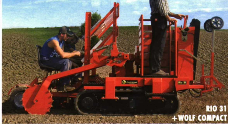
RIO 31 + WOLF COMPACT