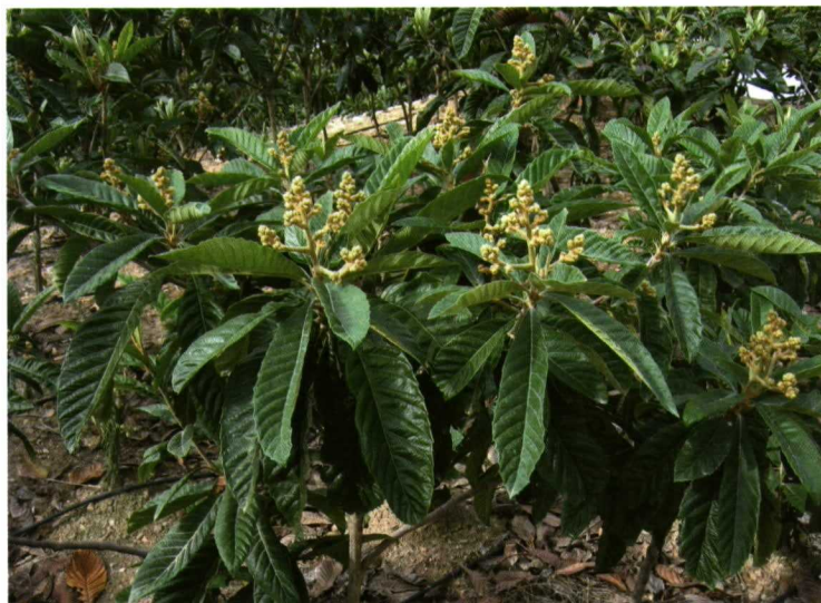
El aclareo químico realizado en floración, una vez cuajados dos frutos supone un importante ahorro de mano de obra en aclareo de frutos y unos mejores precios al anticipar la oferta en el mercado.

Como en otras especies frutales, el tamaño final del fruto en el níspero japonés está inversamente relacionado con el número de frutos desarrollados por panícula. Como también en esta es-