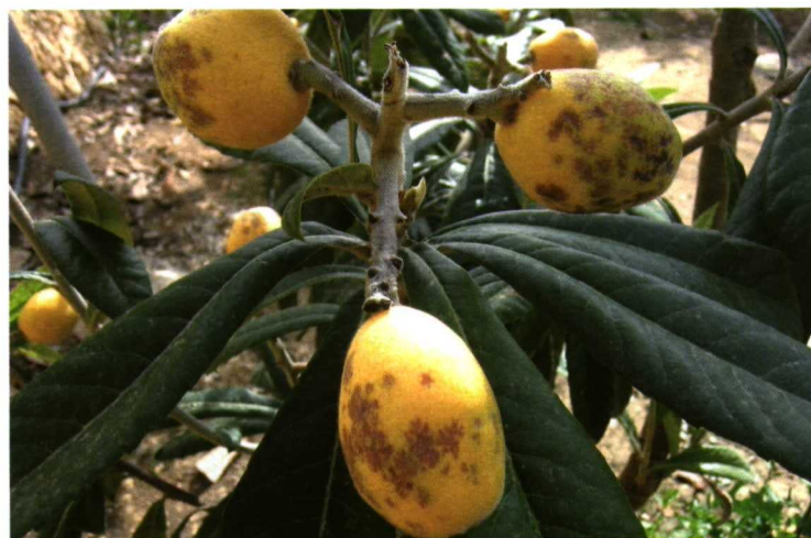
La mancha púrpura se localiza en las capas más profundas de la epidermis del fruto, las cuáles están en contacto ya con la pulpa. Las células se deshidratan y mueren, oxidándose el tejido que adquiere una tonalidad marrón que al transparentarse por el resto de la epidermis, de color amarillo-anaranjado, origina una tonalidad púrpura que da nombre a la alteración.

pecie el tamaño del fruto es un factor de calidad de gran importancia (Gariglio y col., 2001a), el agricultor recurre al aclareo manual de frutos para mejorarla, pero el coste que ello representa se ha cifrado aproximadamente en el 25% de los costes totales de cultivo. La puesta a punto del aclareo químico ha supuesto un importante avance en la tecnificación de este cultivo, dado que permite reducir en más de un 50% los costes de aclareo (Agustí y col., 1999). La utilización de la sal potásica del ácido naftaleno-cético, a una concentración de 20 mg/l cuando son visibles dos frutos recién cuajados por panícula, impide el cuajado de la práctica totalidad de las flores excepto de las ya fecundadas, reduciendo el número de frutos por panícula a cuatro o cinco y anticipando sen-