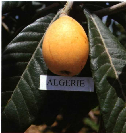
Más del 90% de la producción en la provincia de Alicante corresponde a la variedad Algerie y sus mutaciones, con el peligro comercial y sanitario que supone depender de una sola variedad.

tal subtropical de hoja perenne que florece en otoño y cuyos frutos se desarrollan durante el invierno (Badenes y col., 2006). Aunque originario de China, el níspero llegó a Europa procedente del Japón en el siglo XVIII como árbol ornamental. En el siglo XIX se inició el consumo de los frutos en toda el área mediterránea, donde se adaptó muy bien a las zonas de cultivo de los cítricos (Calabrese, 2006). Frecuente en los jardines y huertos familiares, el cultivo intensivo empezó a desarrollarse a finales de la década 1961-70, cuando comenzaron a implantarse las variedades y técnicas de cultivo actualmente utilizadas. La mayor parte de la producción de nísperos se comercializa para su consumo en fresco, aunque los frutos también se consumen en almíbar, mermeladas y zumos. La miel uniflora del níspero es muy apreciada en las zonas de cultivo (Llácer y Soler, 2001).