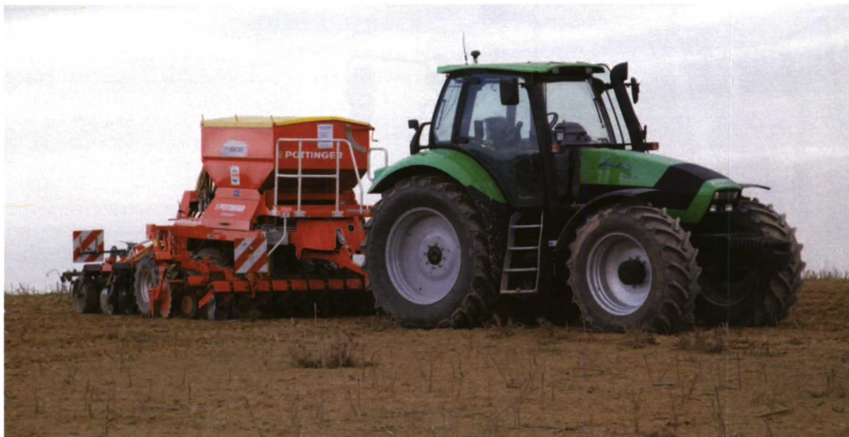
Tractor Deutz con sembradora Pottinger. La siembra con dosis variable está empezando a usarse en nuestros campos, ya que requiere más conocimientos que otras tecnologías.