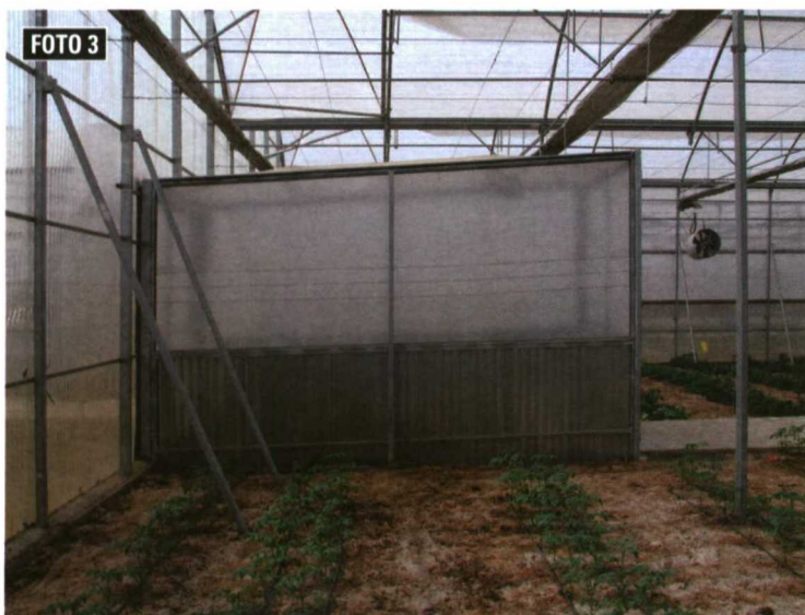
Foto 3. Dentro de los requisitos mínimos constructivos se han considerado diecisiete medidas a adoptar. Entre ellas se encuentra la construcción de antesalas para mejorar el aislamiento térmico de los invernaderos.

Se propone el uso de materiales térmicos (foto 4) y de máxima transmisión de la radiación PAR. En este apartado se han considerado ocho medidas: requerimientos mínimos en cuanto a la transmisión mínima de la radiación solar y máxima de la infrarroja, sombreo, limpieza de la cubierta, reparación, sustitución y dobles o múltiples cubiertas.