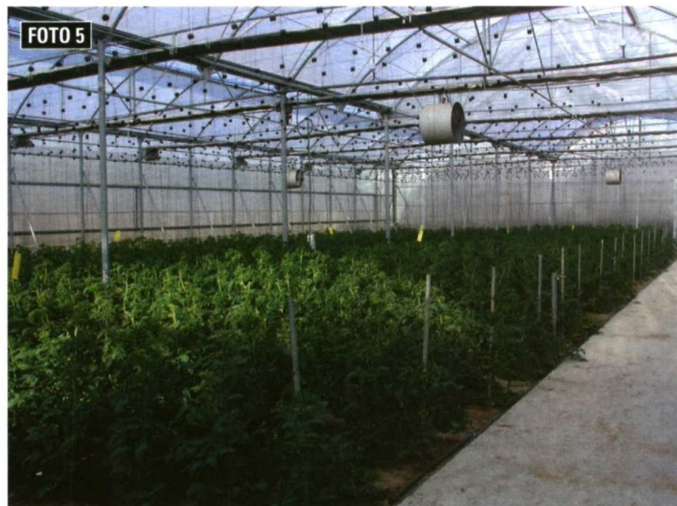
Foto 5. La ventilación natural debería ser optimizada, considerándose ocho medidas entre las que se encuentra el uso de recirculadores.