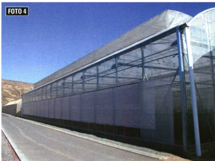
Foto 4. Entre los materiales usados como cubierta de invernaderos se propone el uso de materiales térmicos y de máxima transmisión de la radiación PAR.