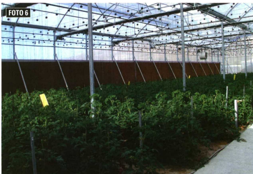
Foto 6. Para cumplir con los requisitos mínimos de refrigeración se propone, entre otros, el uso de paneles evaporadores.

Estas medidas son recomendadas y necesarias en áreas con clima frío y alto riesgo de heladas. Las modificaciones en los sistemas de calefacción están orientadas a optimizar la recuperación de energía calorífica y proporcionar calor a las plantas de manera eficiente. Se han considerado las siguientes medidas: temperatura homogénea, aislamiento de tuberías hasta los invernaderos, dos sistemas independientes de gestión del calor, sistemas variables de calefacción y uso de calefacción por aire.