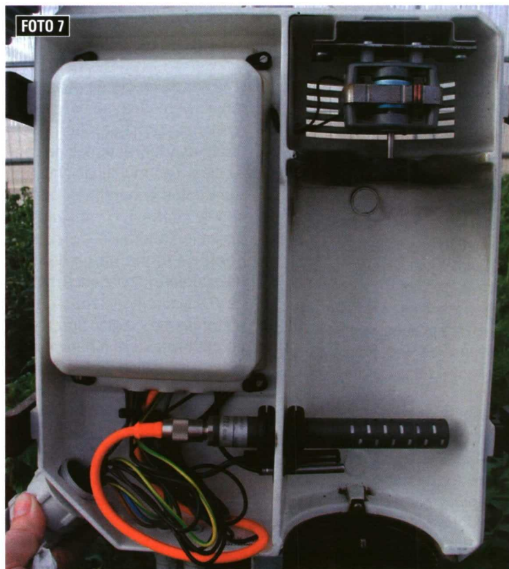
Foto 7. Una de las medidas para un correcto desarrollo del cultivo es el control de la concentración interior de \text{CO}_2 .

Los micotúneles son estructuras de pequeño porte, cubiertas por una lámina de polietileno de 50 \mu\text{m} de espesor y entre 0,5 y 1 m de anchura. Se usan sólo para las primeras etapas de crecimiento, puesto que después las hojas tocan el plástico y es necesario quitarlo para que las plantas sigan creciendo. Permiten aumentar la temperatura en el aire que rodea las plántulas, al disminuir las pérdidas energéticas por radiación infrarroja durante la noche. Ubicándolos por encima de las tuberías de calefacción permiten grandes ahorros de energía al limitar enormemente las pérdi-