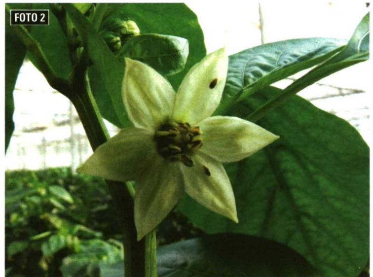
Fotos 1 y 2. En Almería está previsto pasar en esta campaña de 400 a 5.000 hectáreas de invernaderos con sueltas controladas de organismos que son enemigos naturales de las plagas.

ciones de productores, empresas (biofábricas), y las recientemente creadas al efecto empresas de base tecnológica, están haciendo un gran esfuerzo para afrontar con éxito el gran reto que se avecina.