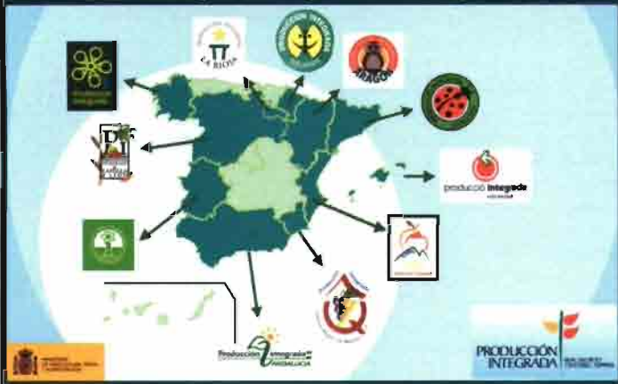
FIGURA 1. Identificaciones de garantía de producción integrada

Por último, la producción integrada conlleva ventajas medioambientales claras, al racionalizar el uso de todos los recursos naturales e insumos agrarios, en especial aquéllos que pueden implicar más riesgos de contaminación, como los productos fitosanitarios.