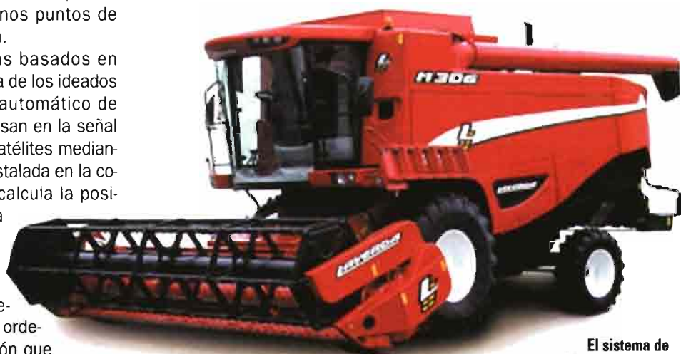
El sistema de compensación en pendiente de Laverda garantiza la nivelación de la máquina en pendientes transversales de hasta el 20% y longitudinales de hasta el 8%.