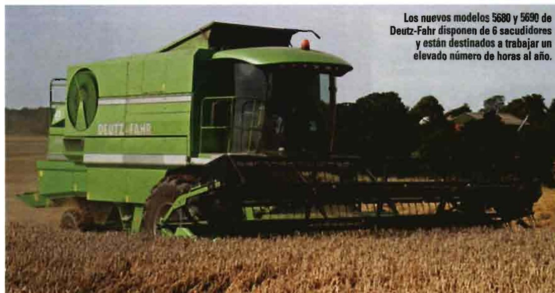
Los nuevos modelos 5680 y 5690 de Deutz-Fahr disponen de 6 sacudidores y están destinados a trabajar un elevado número de horas al año.

Otra innovación importante en los modelos de gama alta es el sistema de limitación de la velocidad de avance en función de lo sobrecargados que estén los órganos de trilla y separación. Algunos fabricantes optan por poner sensores electrónicos de esfuerzo en el cilindro de trilla y, cuando detecta que está sobrecargado, reducen la velocidad del vehículo. En los últimos sistemas presentados, además, hay sen-