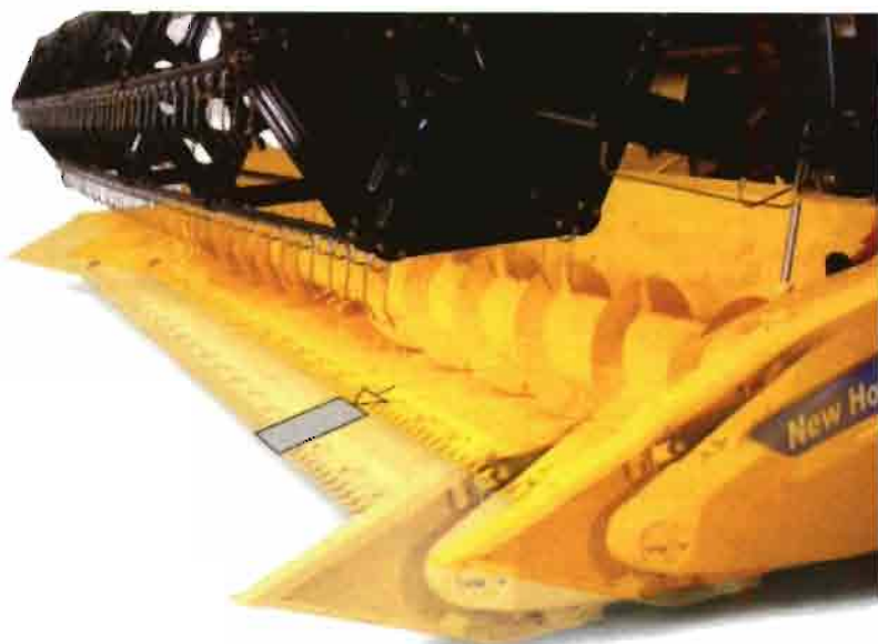
Los cabezales de grano con bandeja extraíble desde la cabina son prácticos para adaptarse a condiciones y cultivos difíciles.

Lo que sí se consolida es la revolución que supuso la llegada de los sistemas de separación rotativa, prescindiendo de los sacudidores. Aunque inicialmente esta tecnología no tuvo mucha acogida en nuestra zona, quizá por la fama de que trataban peor la paja, los distintos fabricantes