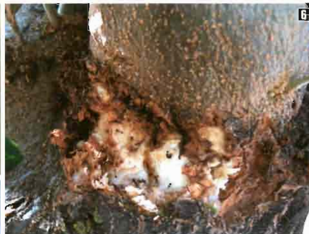
Foto 6. Daño causado por Euzophera pinguis en olivo.