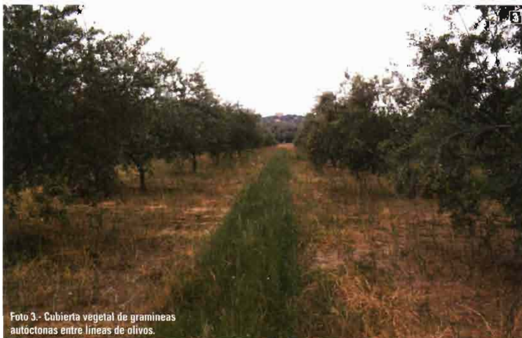
Foto 3.- Cubierta vegetal de gramíneas autóctonas entre líneas de olivos.

De la entomofauna presente en la cubierta vegetal durante los meses de febrero a mayo, el orden Hymenoptera fue el más abundante, destacando la familia Formicidae (hormigas), seguido del orden Homoptera especialmente pulgones. Otros órdenes bien representados fueron Diptera y Coleoptera . Entre los himenópteros se encontraron especies de Elasmidae , Braconidae e Ichneumo-