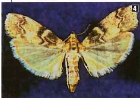
Foto 4. Adulto de Euzophera pinguis (Fuente: HYPP - INRA, Francia).