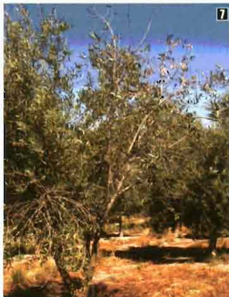
Foto 7. Ramas de olivo secas por el ataque de Euzophera pinguis .

agricultores debidos a daños producidos por las larvas de E. pinguis constituyen el mayor número de consultas que se están produciendo en la actualidad.