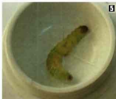
Foto 5. Larva de Euzophera pinguis al final de su desarrollo.