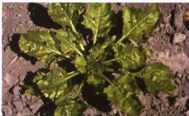
Arriba, deficiencia de manganeso en remolacha. Abajo, daños provocados en hojas de remolacha a causa de una deficiencia en fósforo.