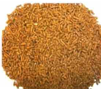
Producto final después del proceso de peletizado.