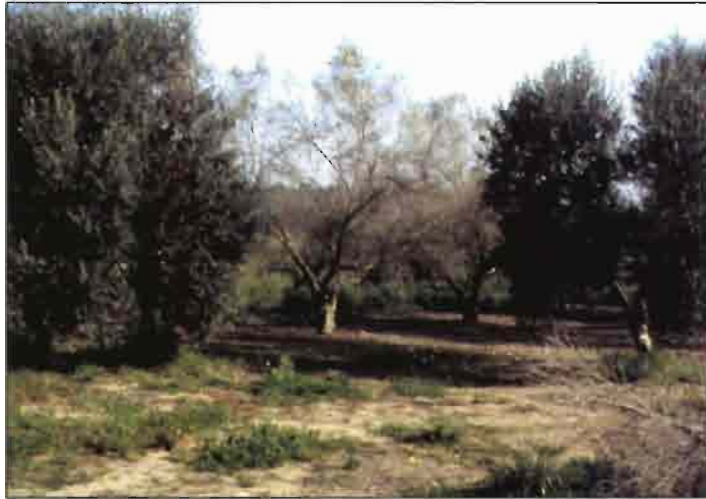
Foto 1. Olivo muy afectado por los "repilos" (centro de la imagen) junto a olivos resistentes.

de hojas infectadas debido a la escasa esporulación del hongo in vitro. El inóculo (conidios) obtenido presentó una germinación aceptable para las inoculaciones (entre el 45% y el 78%), que se realizaron utilizando plantones y hojas separadas de diez cultivares de olivo seleccionados. Los resultados de estas inoculaciones han puesto de manifiesto la existencia de variabilidad patogénica entre distintas poblaciones del hongo, habiéndose identificado seis grupos de virulencia (razas) (Alsalmiya, 2004). En general, no existió una correspondencia entre la procedencia de la población del hongo (varietal o geográfica) y el grupo de virulencia, aunque tres de las cuatro poblaciones que resultaron más virulentas sobre Arbequina procedían de Cataluña, zona de origen de este cultivar. Cabe destacar que los cultivares resistentes ensayados (Arbosana, Frantoio y Lechín de Sevilla) mostraron resistencia a todas las poblaciones del patógeno. Estos resultados confirman observaciones previas realizadas en el Banco de Germoplasma del Olivo de Córdoba, donde varios cultivares susceptibles al Repilo en su zona de origen, como Frantoio, Dolce Agogia o Arbequina, han resultado resistentes o moderadamente resistentes a la población local de S. oleagina . Por el contrario, cultivares considerados resistentes en su zona de origen, como Sant`Agostino, Merhavia o Blanqueta, son muy susceptibles en el ensayo de Córdoba (López-Doncel, 2003).