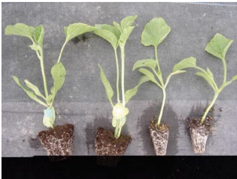
Foto 1. Planta de albizoz injertada (izquierda) y sin injertar (derecha)