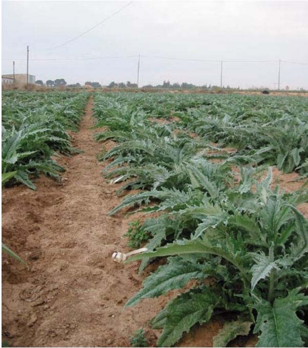
Fotos 2 y 3. Estado de los capítulos a fecha de 18 de octubre en los tratamientos T-1 (Foto 2) y T-2 (Foto 3)