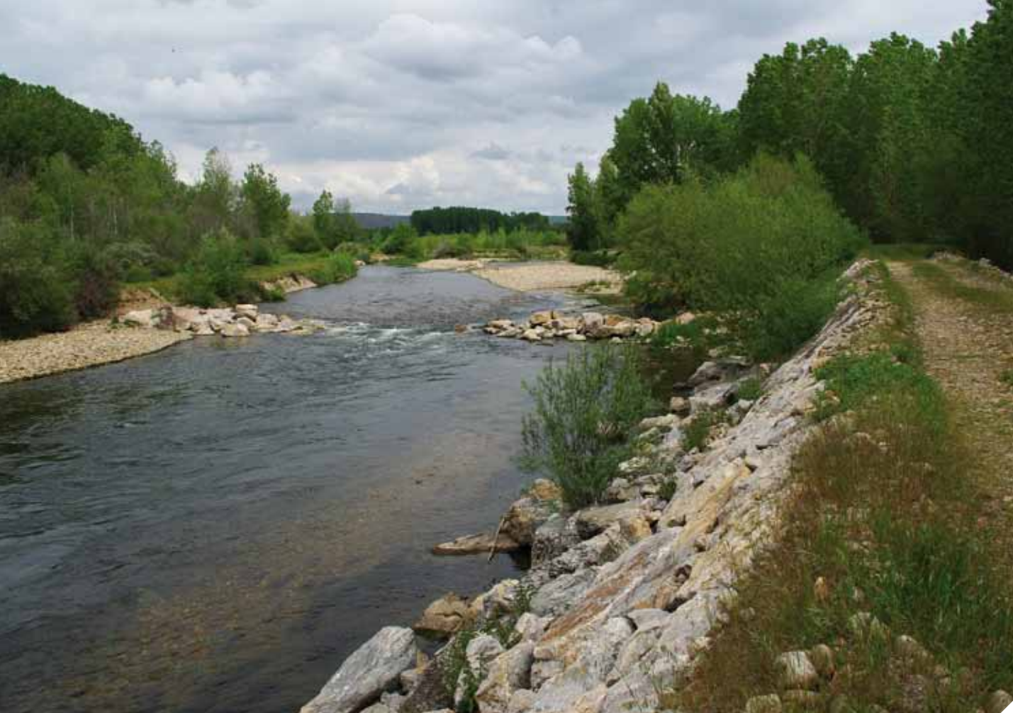
▲ Mota protegida con escollera

En los condicionados de las nuevas concesiones y autorizaciones o de la modificación o revisión de las existentes, que incluyan obras transversales en el cauce el Organismo de cuenca exigirá la instalación y adecuada conservación de dispositivos que garanticen su franqueabilidad por la ictiofauna autóctona.