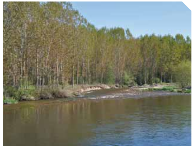
Chopera al borde del cauce

Se añade además el Artículo 126 bis, Condiciones para garantizar la continuidad fluvial , en el que se dispone que el Organismo de cuenca promoverá el respeto a la continuidad longitudinal y lateral de los cauces compatibilizándolo con los usos actuales del agua y las infraestructuras hidráulicas recogidas en la planificación hidrológica.