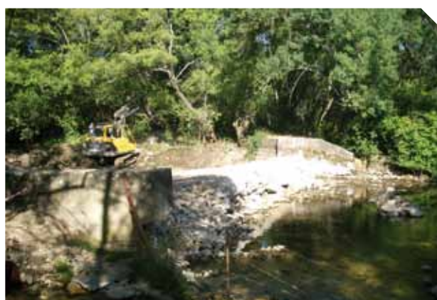
▲ Demolición azud obsoleto

Se dispone además que para el otorgamiento de nuevas autorizaciones o concesiones de obras transversales al cauce, que por su naturaleza y dimensiones puedan afectar significativamente al transporte de sedimentos, será exigible una evaluación del impacto de dichas obras sobre el régimen de transporte de sedimentos del cauce y que en la explotación de dichas obras se adoptarán medidas para minimizar dicho impacto.