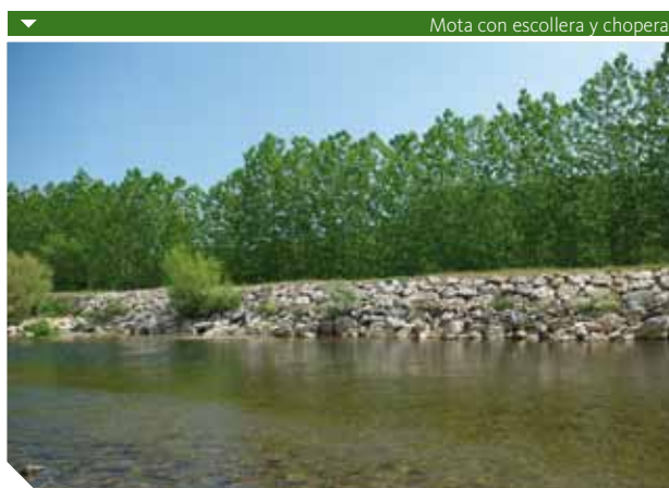
▼ Mota con escollera y chopera