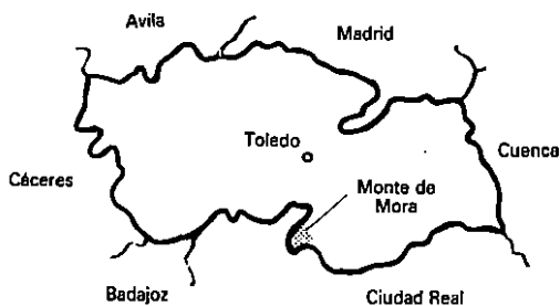
Fig. 1. Ubicación geográfica de la zona estudiada.

1959, y se extienden, principalmente, por gran parte de la raña central de las Navas.