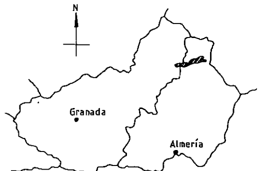
Fig. 1. Situación de la Sierra de María.

Desde el punto de vista geológico la sierra está formada por un anticlinal con núcleo de dolomías grises, correspondiendo su masa principal a calizas del Lias y calizas colíticas blancas (FA-