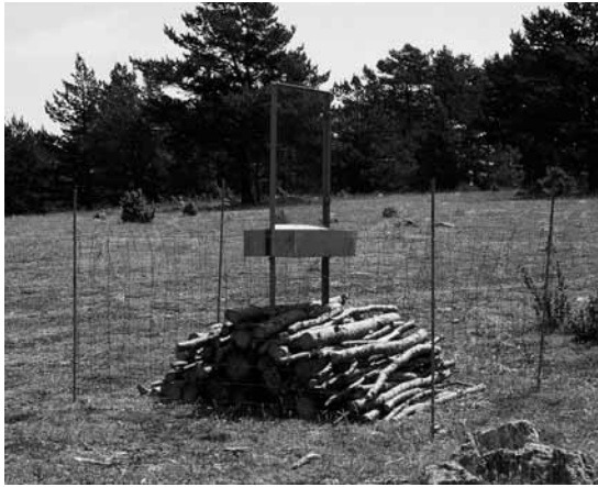
Foto 1 - Trampa de intercepción con cebo natural.