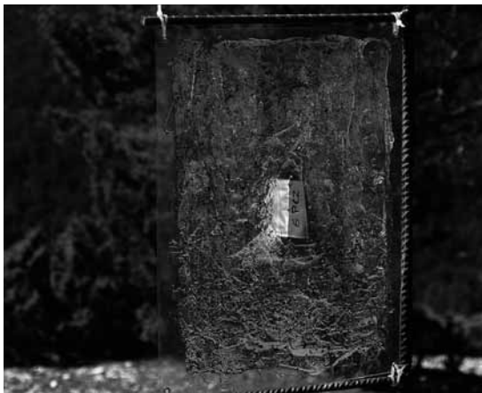
Foto 3 - Trampa vertical adhesiva.