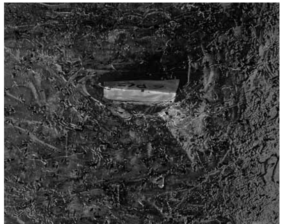
Foto 4 - Detalle de capturas en trampa adhesiva.