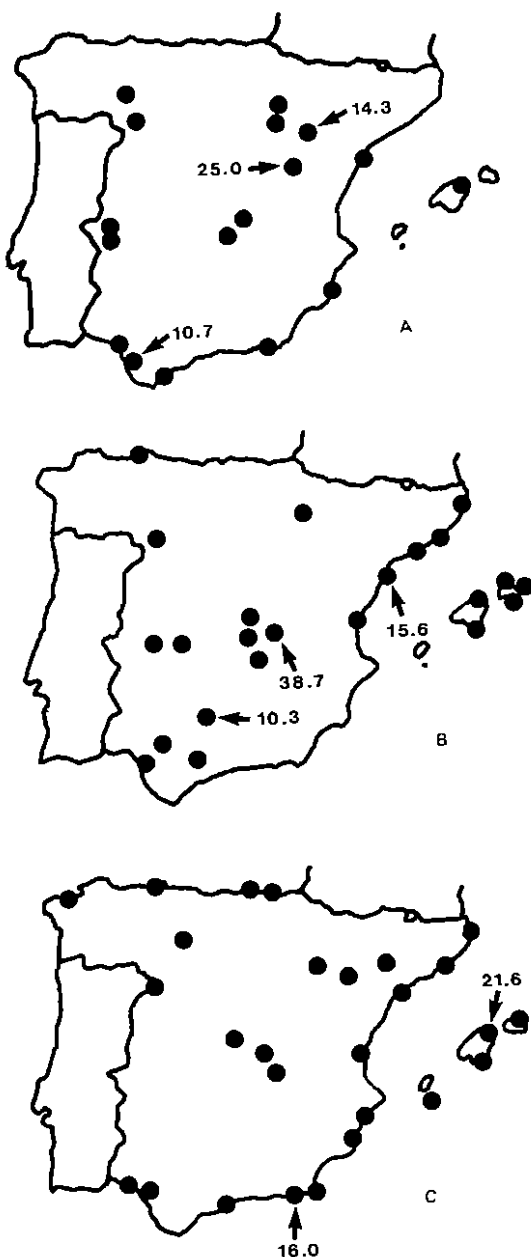
Fig. 3. Localidades de observación del Correlimos de Temminck en España. A: Invernada (noviembre-febrero); B: Migración prenupcial (marzo-mayo), y C: Migración postnupcial (julio-octubre). Las flechas indican localidades con más del 10% sobre el total de aves en cada época y su porcentaje correspondiente.

El correlimos de Temminck aparece en todo tipo de zonas húmedas, principalmente interiores y de agua dulce, aunque también se cita en marismas y estuarios costeros (BERNIS, 1966; CRAMP & SIMMONS, 1982). En la Tabla II se ilustra la impor-