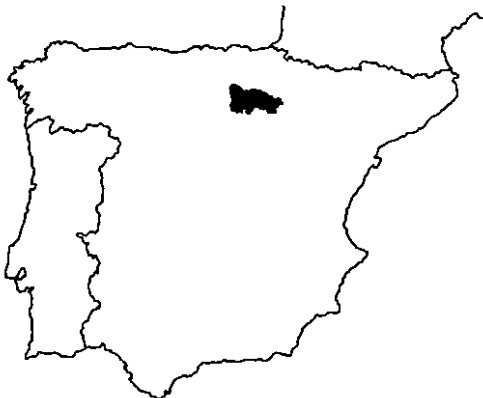
Fig. 1. Situación de La Rioja en la Península Ibérica.

Para el estudio histórico de los grandes mamíferos se ha recopilado la información que sobre éstos aparece en el Diccionario Geográfico-Histórico-Estadístico realizado por MADDOZ (1833-1843); la validez de la misma ya ha sido tenida en cuenta por otros autores (TELLERÍA y SÁEZ-ROYUELA, 1983). Estos datos han sido comparados con los aportados por BRAZA et al. (1989). Si bien éstos son algo incompletos respecto a la distribución actual del ciervo y corzo en La Rioja (DIRECCION GENERAL DE MONTES Y CONSERVACION DE LA NATURALEZA, datos inéditos) son válidos para mostrar la tendencia experimentada por estos cérvidos en los dos últimos siglos. Respecto a la distribución actual del lobo se realizaron prospecciones en las cuadrículas señaladas con el fin de encontrar rastros, huellas o excrementos. Por último, se consultó la colección de mamíferos del MUSEO NACIONAL DE CIENCIAS NATURALES (de ahora en adelante lo denominaremos MNCN).