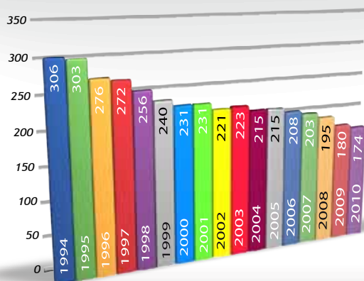
EVOLUCIÓN DE LA FLOTA