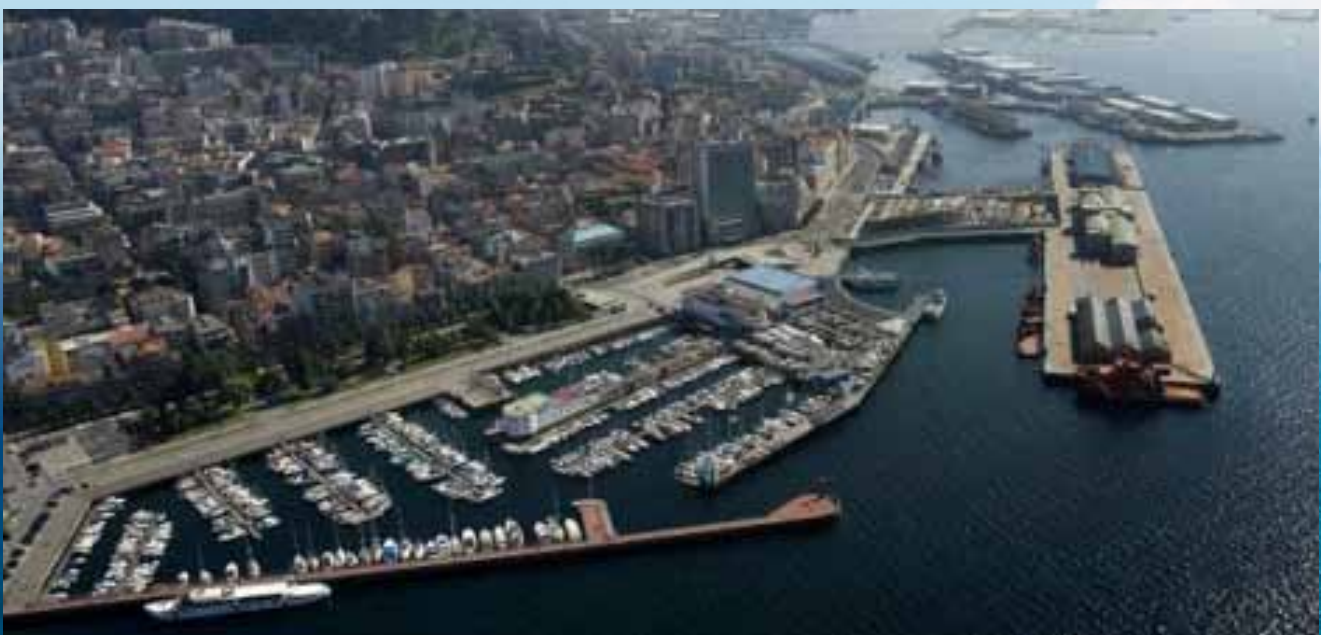
Puerto de Vigo.

Por otra parte, las actuaciones llevadas a cabo durante el periodo analizado han favorecido el desarrollo de una gestión sostenible de los recursos pesqueros y la conservación y preservación del medio marino.