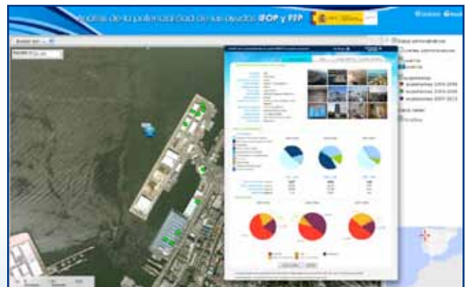
Estudio del puerto de Vigo.

Las ayudas financieras europeas han favorecido la construcción y modernización de las instalaciones del puerto, la mejora de las lonjas, que ha redundado también en una comercialización y distribución más prósperas, dotando a sus productos de un mayor valor añadido. Todo ello ha generado así mismo una mejora en la competitividad de las empresas pesqueras ubicadas en él.