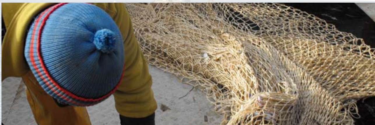
Pescador manipulando el copo.

aportación económica, seguida de la Administración General del Estado con un 25%. Tras éstas se encuentran Andalucía, País Vasco y Comunidad Valenciana, con un 13%, un 12% y un 7% respectivamente. Finalmente, las Comunidades con menor aporte financiero para este primer eje son Cataluña, con un 5%, Murcia, con un 3%, seguidas de Asturias y Cantabria, con un 2% cada una, y Baleares y Canarias con tan sólo un 1% respectivamente.