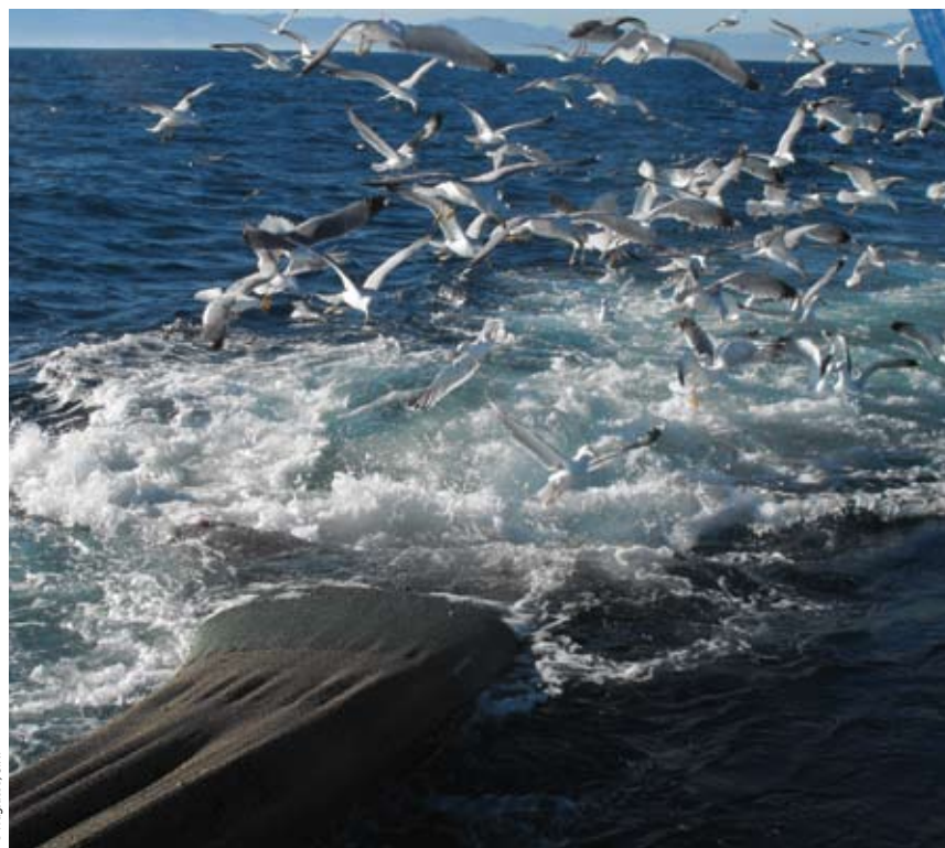
Gaviotas en torno a un aparejo mientras es virado.

Los Planes de Ajuste son los encargados, por tanto, de regular las paralizaciones de las flotas, tanto definitivas, a través del desguace de buques, su reconversión o la transformación para crear arrecifes artificia-