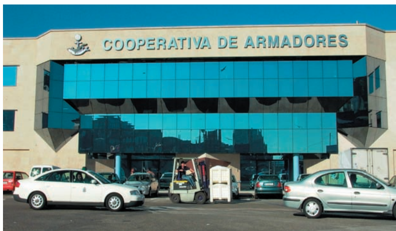
Oficinas principales de la Cooperativa de Armadores de Vigo.