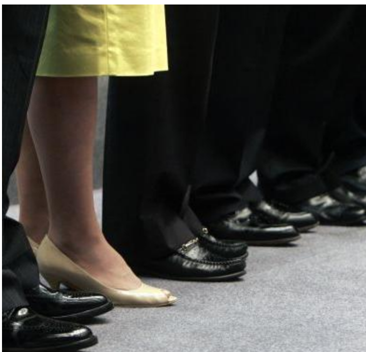
Existe un fuerte desequilibrio entre hombres y mujeres en puestos directivos.

Un factor clave en la consecución de una verdadera igualdad de oportunidades es el logro del empoderamiento femenino y la participación equitativa de ambos sexos en los órganos donde se toman las decisiones que afectan al sector pesquero. Por ello, es necesario impulsar el liderazgo y protagonismo de las mujeres, de forma que adquieran mayor capacidad