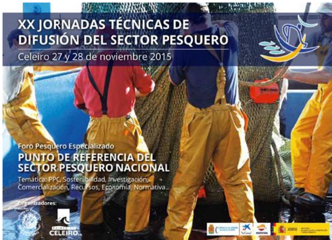
Cartel divulgativo de las jornadas.

Más de una docena de ponentes se dan cita para abordar los retos presentes y futuros de la Política Pesquera Común