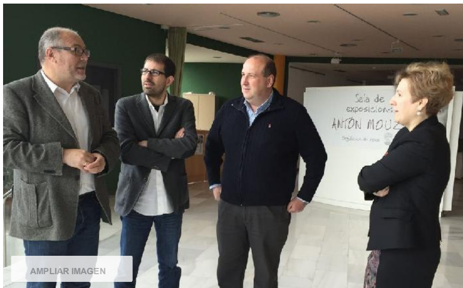
ALVELA El alcalde y los técnicos ayer en la Casa da Cultura.

07 de mayo de 2015. Actualizado a las 05:00 h.