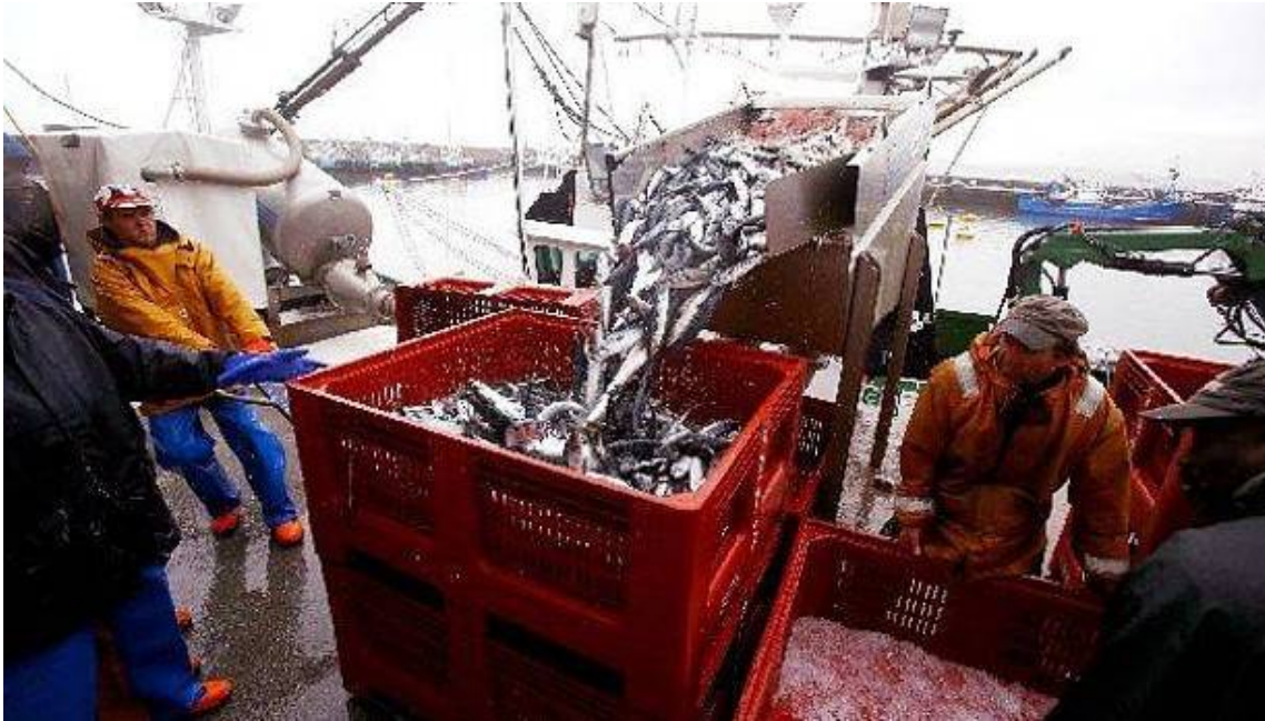
Varios arrantzales descargan chicharros

Ramon Basaldua - Sábado, 9 de Mayo de 2015 - Actualizado a las 06:04h