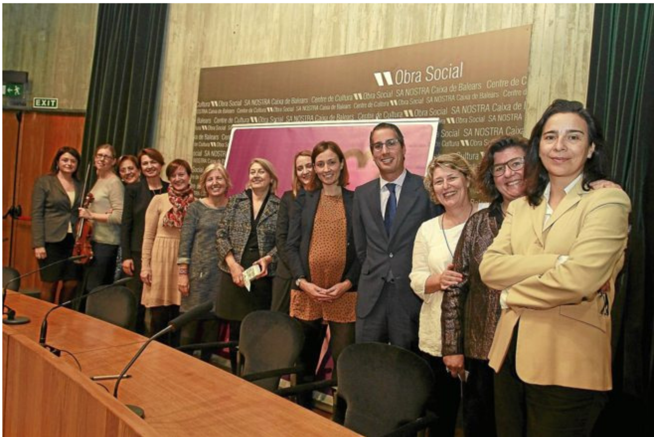
Participantes y organizadoras del II Foro de Mujeres en el Sector Turístico.

Las mujeres están más formadas, pero ocupan menos despachos y sufren más paro