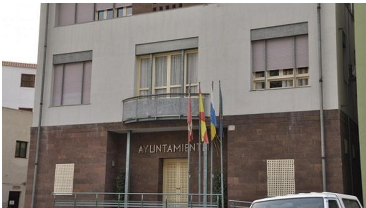
Ayuntamiento de Valle Gran Rey

Se trata de subvenciones destinadas a financiar proyectos que se adecuen a los criterios fijados en los Planes Estratégicos Zonales de los Grupos de Acción Costera existentes en Canarias, en el marco del Eje 4 “Desarrollo Sostenible de las Zonas de Pesca”, cofinanciadas por la Unión Europea a través del Fondo Europeo de Pesca (FEP).