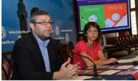
El Cabildo presenta la campaña 'Mejor Compartidas'

El Marco Estratégico Tenerife Violeta se ha configurado como un modelo de Gobierno Abierto para las políticas locales de igualdad de oportunidades entre mujeres y hombres participativo y transparente, con un reparto de poderes entre actores y centros decisorios públicos y privados que refuerce las capacidades organizativas, de gestión y explotación, y de la utilización sostenible de los recursos territoriales y sectoriales existentes, garantizando la incorporación del enfoque integrado de género. Actualmente forman parte 80 entidades y una red de 144 agentes clave, como representantes de las mismas.