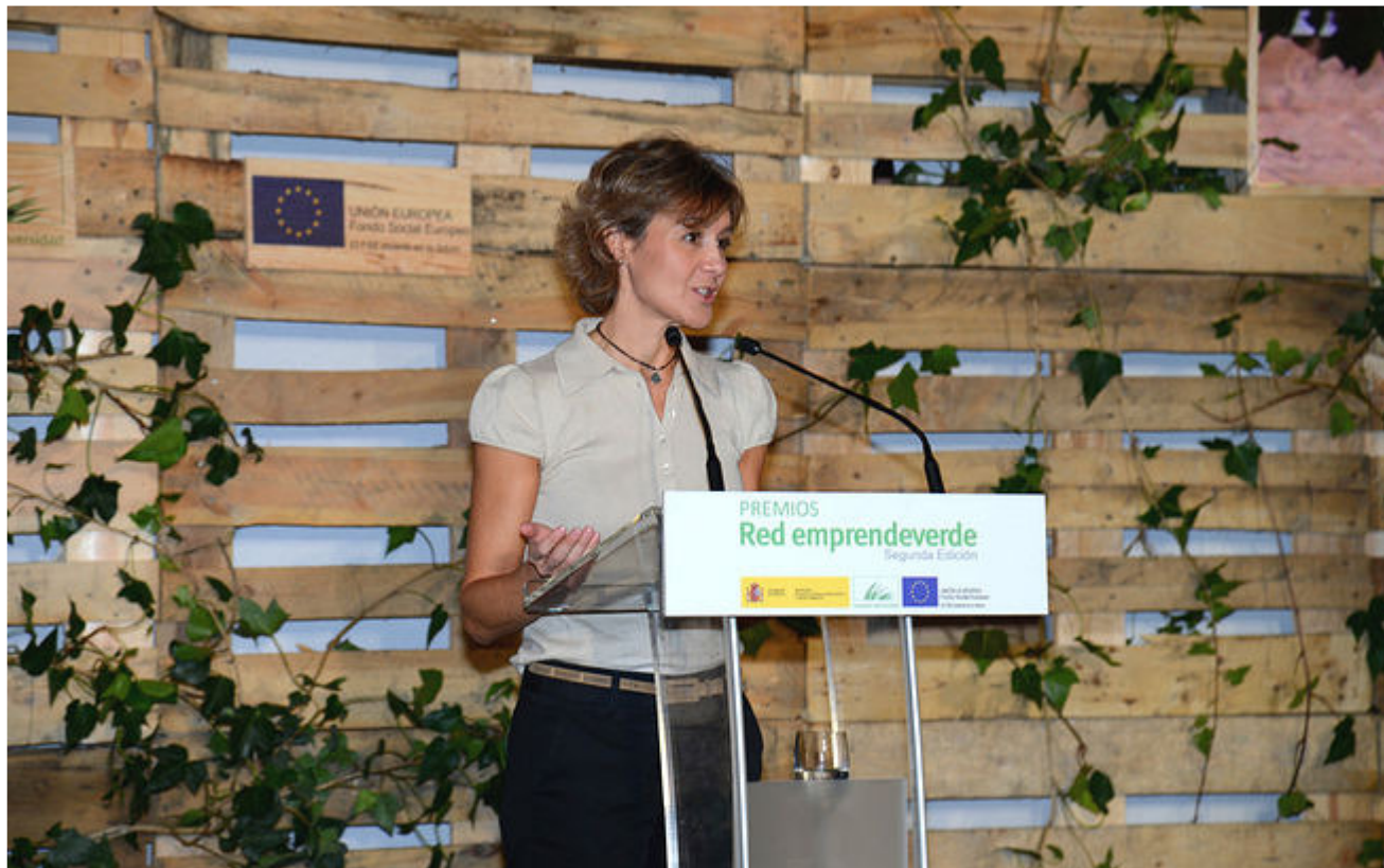
García Tejerina: “La innovación y el emprendimiento son un motor imprescindible para crecer y crear empleo”.

OBSERVACIÓN: La Información ofrecida a continuación ha sido obtenida mediante un sistema de búsqueda en Internet a petición del usuario. Su titularidad corresponde a la Web de origen Fuente salvo lo dispuesto en la misma. Ver Aviso Legal.