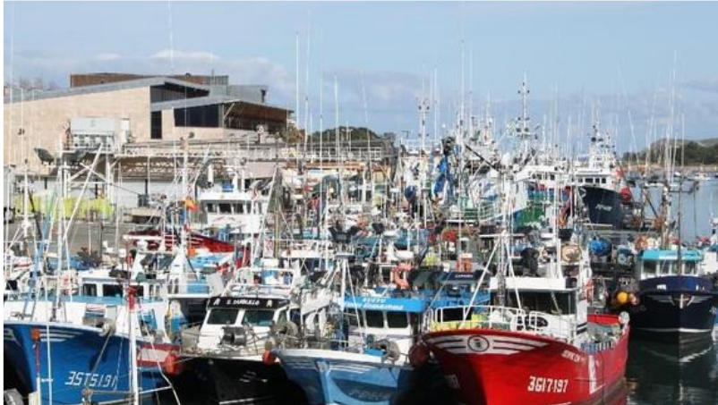
Puerto de San Vicente de la Barquera.

Los puertos de San Vicente, Comillas y Suances podrán beneficiarse de iniciativas que buscan la diversificación y el desarrollo de propuestas innovadoras