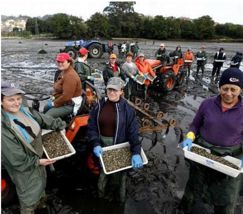
Las mariscadoras de Vilaboa depositarán en Riomaior cuatro millones de cría de almeja este otoño. r. leiro

Es como sembrar en tierra, pero en la playa en marea baja. Los tractores solo tienen que cambiar los surcos en las fincas por la arena de Riomaior y mujeres las semillas de maíz o de grano por las crías de almeja de un tamaño inferior a la uña de un dedo. Y el resto es ponerse manos a la obra y trabajar durante varias horas hasta conseguir el objetivo. Ayer, medio centenar de mariscadoras de la cofradía de Vilaboa dedicaron la mañana precisamente a esta insólita visión para las personas que viven tierra adentro. El mar también se ara y los surcos también se abren en las playas.