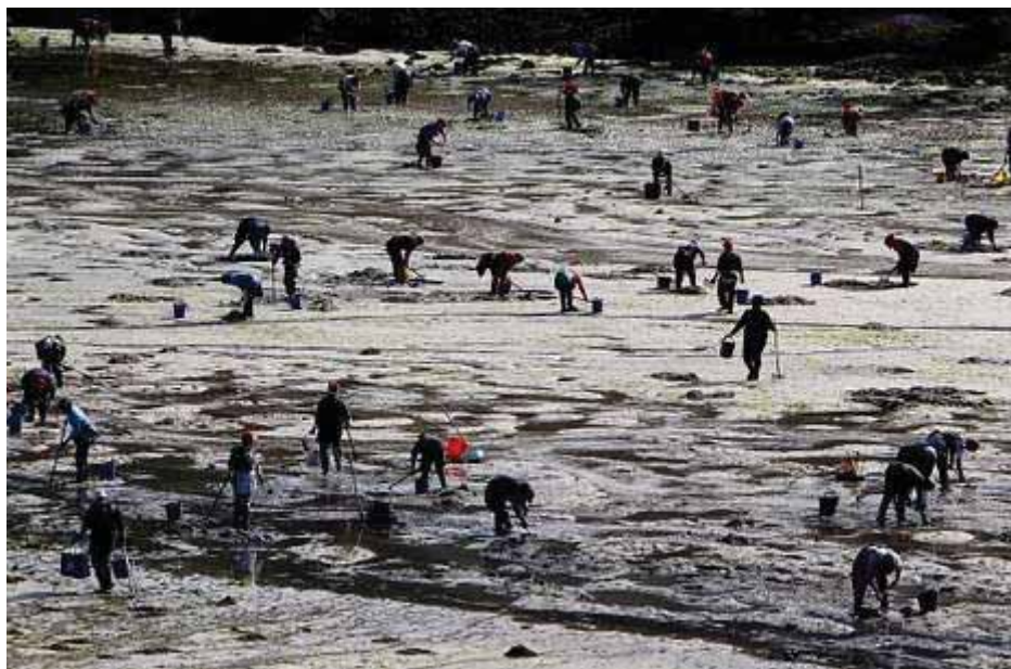
Mariscadoras de la cofradía de O Grove trabajando en el banco de Meloxo. martina miser

redacción / la voz 08 de junio de 2014 05:00