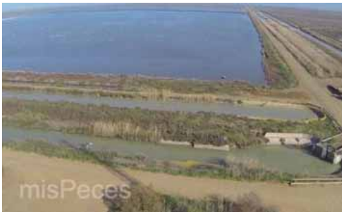
Sistema Cultivo Extensivo en Veta La Palma

Sevilla 17/06/2014 - La empresa sevillana Pesquería Isla Mayor ha sido reconocida en los premios de Agricultura y Pesca 2013 de la Junta de Andalucía en la categoría diversificación económica.