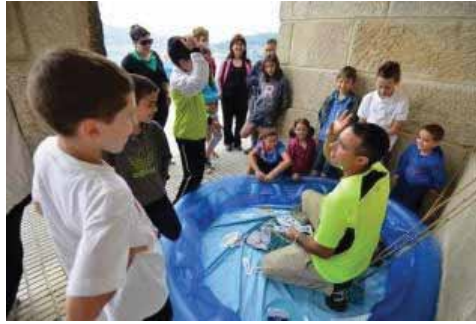
Un momento de la jornada, ayer, en Vilaboa.

La jornada se desarrolló siempre bajo la máxima de conseguir un aprendizaje lúdico. Así se desarrollaron varios juegos didácticos. La iniciativa concluyó con una excursión a la playa de Riomaior. Los participantes pudieron comprobar en este arenal las técnicas de trabajo de las mujeres que se dedican al marisqueo.