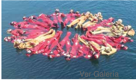
Participantes en un curso de formación de marineros.

El grupo de alumnos participó ayer en las clases de supervivencia en el mar, que incluía la utilización de una balsa salvavidas, y en los próximos días (hasta el lunes) les esperan la formación teórica.