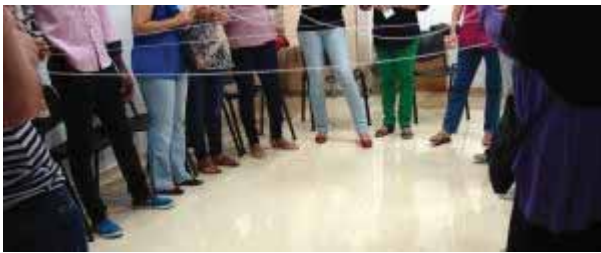
Un momento del curso.

Estereotipos y mandatos de género, lenguaje sexista, violencia machista, desequilibrio en el reparto de tareas y cuidados versus coeducación, lenguaje igualitario, corresponsabilidad y conciliación, nuevas masculinidades... Son algunos de los temas trabajados estos días, en el curso de Sensibilización en igualdad de oportunidades , organizado por el Área Social de Málaga Acoge e impartido en la sede de la Axarquía . La iniciativa cuenta con un total de 10 horas de duración repartidas en cuatro sesiones de dos horas y media, de las que ya se han realizado dos. Una quincena de personas están participando en esta formación, incluida dentro del proyecto de Intervención Integral con Mujeres en el Ámbito Familiar .