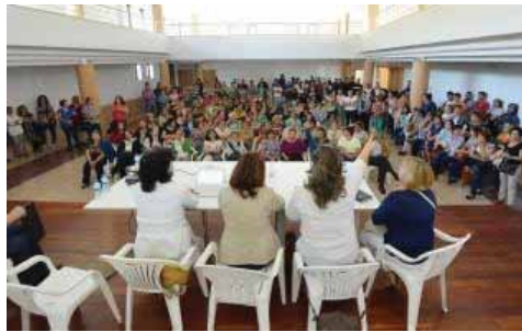
Multitudinaria reunión de las mariscadoras con el Intecmar.

El año 2014 se está convirtiendo en el peor ejercicio para el sector marisquero del fondo de la ría. Las cofradías de Lourizán, Pontevedra y Raxó ya acumulan en estos primeros cinco meses pérdidas de casi un millón de euros en la venta de almeja y berberecho con respecto al mismo periodo del pasado año, que tampoco fue de los mejores. Según los datos provisionales de la Plataforma Tecnológica da Pesca de la Xunta, la lonja de Campelo, que canaliza la inmensa mayoría de la producción del fondo de la ría, ha facturado desde el 1 de enero 542.000 euros por la venta de 88.000 kilos de almeja y berberecho, lo que supone un descenso del 63% con respecto a las cifras de enero a mayo de 2013, cuando se alcanzaron unos ingresos de casi 1,5 millones de euros y se movieron 214.000 kilos de bivalvos.