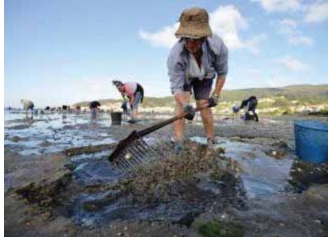
Decenas de mariscadoras, durante un día de actividad en las inmediaciones de Combarro.

La tensa espera en el sector tendrá en el mejor de los casos una respuesta que se quedará lejos de cubrir los ingresos medios de una mariscadora en un mes de trabajo. Desde las cofradías calculan que la ayuda que el ISM analiza si concede o rechaza apenas supondría ese 80 por ciento del salario mínimo interprofesional, establecido actualmente en 645,30 euros.