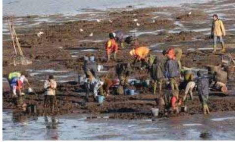
Un grupo de mariscadoras durante un día de trabajo en el fondo de la ría.

Las mariscadoras del fondo de la ría están a la espera de que se resuelvan las casi 400 solicitudes que presentaron en el Instituto Social de la Marina (ISM) para percibir una ayuda económica tras dos meses sin poder trabajar por marea roja. Una solución que se presenta como la única posible ante un panorama desalentador y que, en todo caso, supondría una prestación del 80 por ciento del salario mínimo interprofesional.