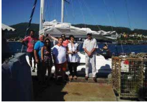
Delegación búlgara, en la batea de a volandeira.

La delegación búlgara que visitó Cangas constaba de 11 personas y se agrupaban bajo el nombre de Prmoscok Tsarevo Sozopol. Un poco antes de llegar a Cangas, el GAC de la zona llevó a sus miembros a Vilaboa, donde pudieron comprobar las dificultades que había con la extracción de algas. Por la mañana temprano habían estado en Baiona, concretamente en la lonja de la villa, donde pudieron ver como funcionaba. También visitaron el museo de Meirande. Para la delegación búlgara fue toda una experiencia esta última, porque uno de los proyectos que pretenden llevar a cabo en su país dentro de los Grupos de Acción Costera es precisamente un museo. Hoy, la delegación de Bulgaria será recibida por el alcalde de Baiona y con posterioridad se trasladarán a A Guarda.