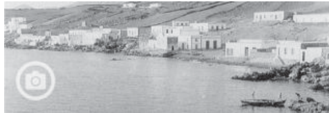
El pueblo de pescadores La Tiñosa, en los años cincuenta.

El crecimiento residencial en la última década ha sido relevante en Costa Teguise, donde vive cerca de la mitad de la población del municipio, unas 8.300 personas. Teguise ha triplicado su vecindad en el último medio siglo y tiene ya unos 21.000 inscritos en su censo. A finales del pasado año tenía 17.362 camas turísticas.