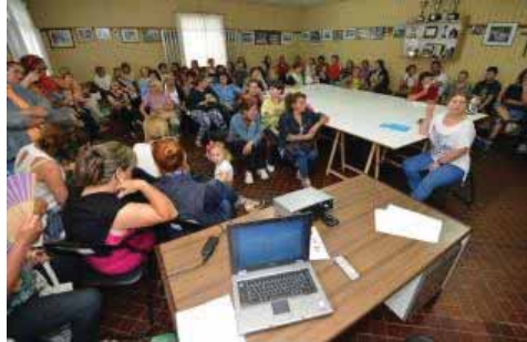
Un momento de la reunión de ayer en la cofradía de Lourizán.

El sector del marisqueo sufre un nuevo revés con el cierre de los bancos que todavía estaban abiertos en el fondo de la ría. El repunte de toxina en la zona V ahonda en la crítica situación de las 400 mariscadoras que trabajan en esta zona y que llevan más de dos meses sin poder faenar con normalidad. La decisión que se adopta en esta zona, la de los arenales más próximos a Pontevedra, afecta a la extracción de almeja. La captura de navaja y longueirón está permitida.