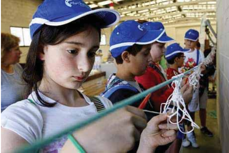
Los escolares emularon a las rederas de Malpica.

Escolares de Malpica disfrutaron ayer de una entretenida mañana de actividades en torno al mundo de la pesca gracias al proyecto del GAC3 Come o mar y a una iniciativa denominada Pequechefs do mar. Los alumnos se desplazaron hasta el puerto de la localidad para participar en dos obradoiros. En uno de ellos pudieron conocer de primera mano el trabajo que hacen las rederas y que permite que los barcos salgan a faenar con los aparejos que precisan para capturar los peces. Además, fueron a la lonja para ver de cerca algunas de las especies que los marineros traen de regreso al puerto y para ponerse en la piel de los cocineros que las transforman en sabrosos platos. La actividad fue organizada con la colaboración del Concello de Malpica, la cofradía de pescadores, la asociación de Redeiras Artesás O Fieital y los centros escolares del municipio. Hoy se celebrará una segunda sesión a partir de las 10.00 horas.