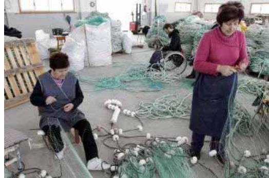
Las rederas capean el temporal

Las rederas de A Guarda no dejan de trabajar ni aun cuando el fuerte temporal de los últimos días causó daños en la nave donde trabajan. Las mujeres, red en mano, pasan horas hilando fino mientras el mar embravecido dejaba una espesa capa de espuma sobre el paseo marítimo y olas gigantescas de hasta doce metros de altura. El tiempo parece que da una tregua estos días en las Rías Baixas, con lluvias propias de esta época pero sin ciclogénesis explosiva a la vista, como la que sorprendió a estas trabajadoras en plena faena.