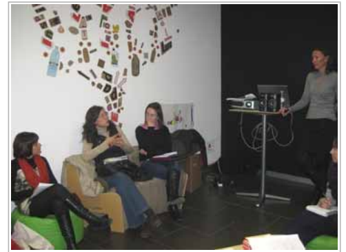
Encuentro de empresarias en el CADE de Huelva