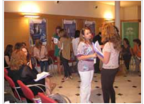
Participantes en uno de los talleres de Red de Cooperación de Emprendedoras desarrollados en 2013 en Almería.

Además, se han realizado 55 asesoramientos a empresarias de la provincia de Almería que han permitido la materialización de 25 acuerdos de cooperación entre empresarias y se han organizado 49 acciones dirigidas a empresarias y emprendedoras (formación, talleres de emprendimiento femenino, networking, etc.) en las que han participado 543 mujeres.