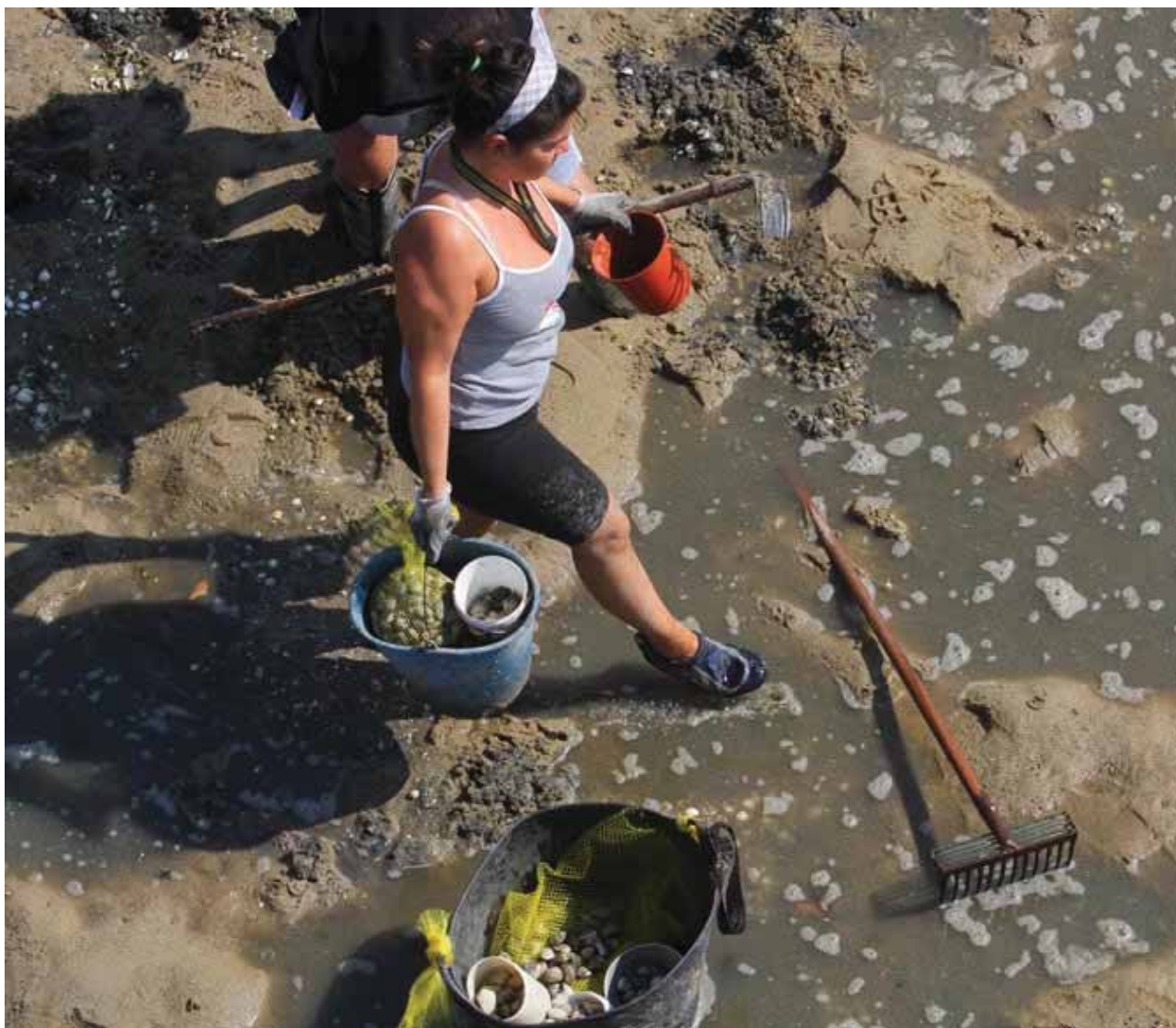
Mariscadoras faenando en O Terrón, Vilanova e. moldes

redacción vilagarcía | 03 de Enero de 2014