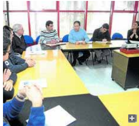
Un momento de la reunión con el sector pesquero portuense.

El concejal de Fomento, Agricultura y Pesca ha reunido a los diferentes colectivos que conforman el sector local de la pesca para "aunar todos los esfuerzos" encaminados a conseguir que la Junta de Andalucía de marcha atrás y permita que El Puerto se adhiera a uno de los grupos de desarrollo pesquero, como podría ser el Grupo de Desarrollo Zona de Pesca Cádiz Golfo en el que están integrados los municipios vecinos de Sanlúcar de Barrameda, Chipiona y Rota, o bien, constituyendo otro de nueva creación.