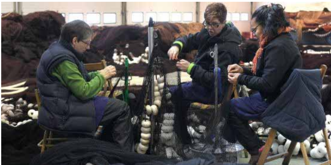
Un grupo de rederas trabaja en el puerto de Hondarribia.

Archivado en: Izaskun Bilbao Comisión Europea EAJ-PNV Pesca País Vasco Mujeres Partidos políticos España UE Organizaciones internacionales Europa Relaciones exteriores Agroalimentación Sociedad Política