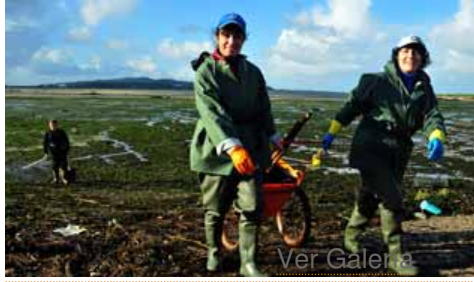
Mariscando en Cambados

Éste consiste en unos carritos "artesanales" hechos con neumáticos de bicicleta o de carritos de bebés, radios de plástico y una estructura de acero inoxidable para transportar los capazos con el marisco y los aparejos de trabajo. "Al principio los radios también eran de acero inoxidable, pero la salitre del mar los estropeaba pronto, así que se cambiaron por los de plástico", explica la presidenta de la agrupación de mariscadoras de Cambados, Isabel Pérez.