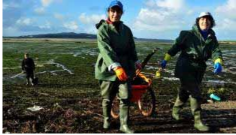
Las mariscadoras de Cambados aprovechan las primeras "secas" del año, pero las habrá más importantes. Al fondo, A Toxa.

En Vigo habrá varias jornadas con la bajamar a 0,2 metros, sobre todo en agosto y septiembre, al igual que ocurrirá en A Coruña a principios del mes que viene y de marzo, el 11 de agosto y a mediados de septiembre.