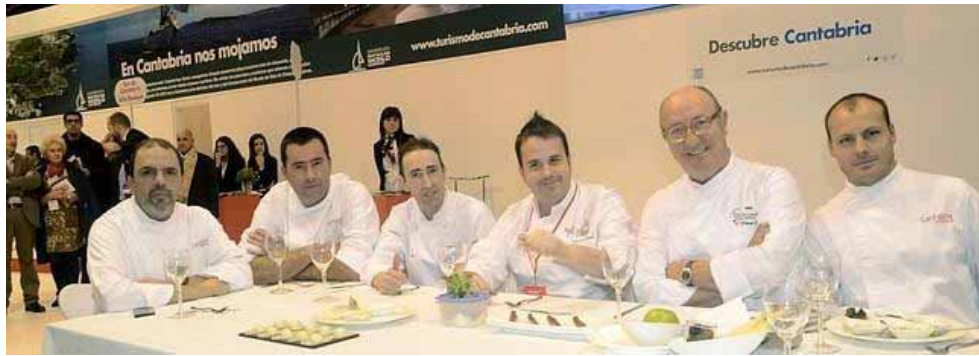
Cocineros cántabros en Fitur.

El Patrimonio náutico y marítimo de Cantabria junto con la gastronomía han acaparado la atención del numeroso público que ha visitado en la jornada de hoy el stand de Cantabria en la Feria Internacional de Turismo, Fitur 2014.