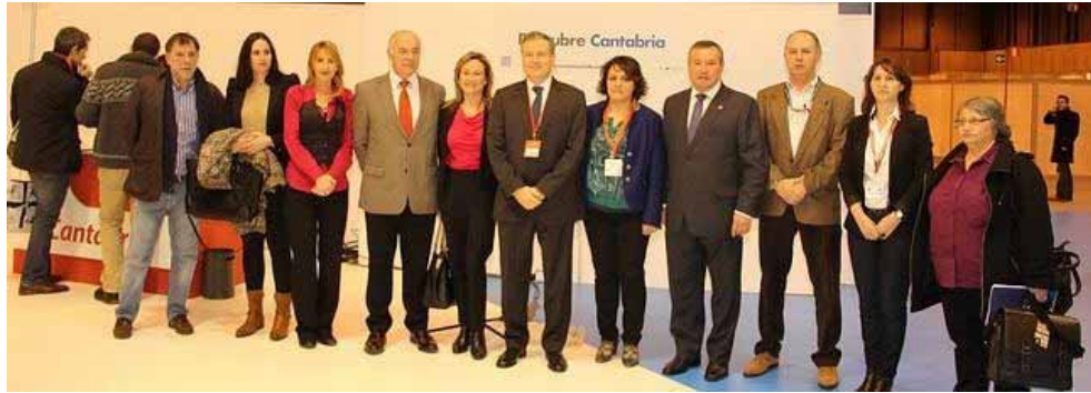
Representantes de la Asociación Villas Marineras en Fitur

25.01.14 - 09:42 - Vicente Cortabitarte | Madrid