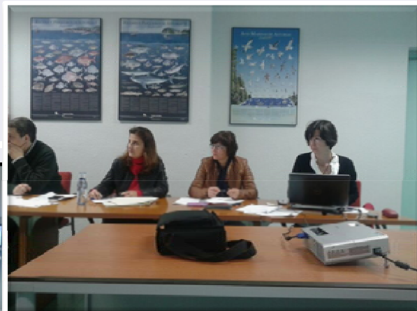
Participantes de la IV reunión del Grupo Técnico de Redes de Pesca