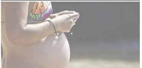
UNA PROTEÍNA HEPÁTICA SE MUESTRA CRUCIAL EN EL EMBARAZO