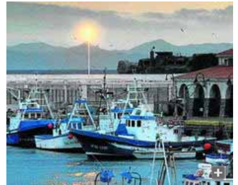
Buques pesqueros en el puerto de Tarifa.

El Grupo de Desarrollo Pesquero (GDP) Cádiz-Estrecho habilitará aulas de formación en la sede de la Cofradía de Pescadores de Tarifa. El proyecto, cuyo acuerdo fue adoptado por el grupo hace unos meses, supondrá una inversión de 77.275,18 euros procedentes al 75% del Fondo Europeo de la Pesca y el 25% restante, de la Junta de Andalucía.