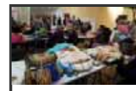
Bolilleras Adra 2013