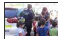
Poli de guardería. cole Abdera