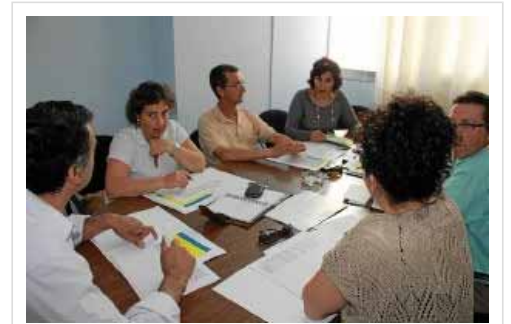
La reunión permitió la valoración de proyectos evaluados por la Junta de Andalucía.

Hasta la fecha, al grupo de desarrollo pesquero se han presentado proyectos que superan con creces las cuantías con las que cuenta dicho grupo, con lo que esta reasignación permitirá la posible incorporación de iniciativas que, en un principio, podrían quedar fuera de las ayudas.