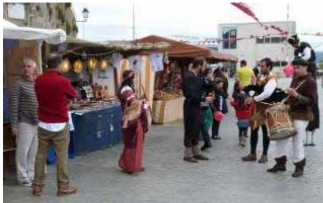
Puestos y actuaciones, ayer en el mercado marinerero de Fisterra.

De turismo gastronómico por la comarca. El Grupo de Acción Costera (GAC) pretende promocionar el turismo en la zona con el programa 'Come o mar', que incluye menús degustación y tapas variadas elaboradas con productos del mar, entre otras iniciativas. Las propuestas serán los fines de semana de junio en los establecimientos que se sumaron al programa, con menús variados y asequibles. Este fin de semana se celebró el primer mercado marinerero de Fisterra, dentro de la misma iniciativa, y el 14 será en Camariñas