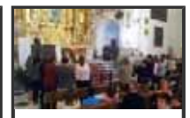
El Obispo en la Alpujarra