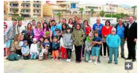
El grupo de Argar disfrutó mucho en esta travesía.