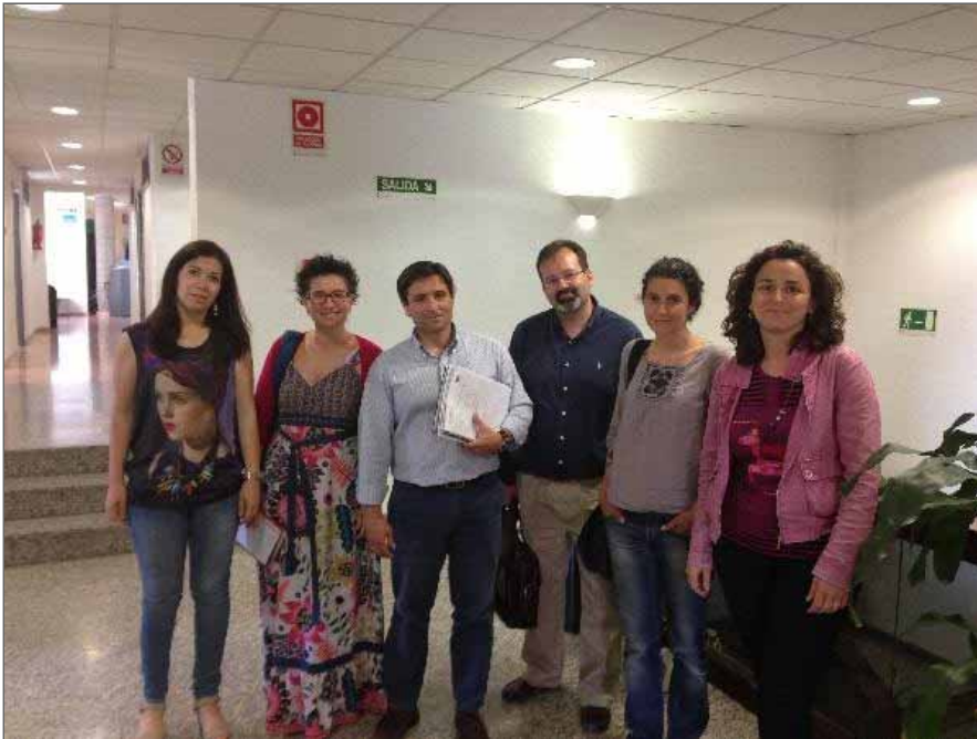
Participantes en la reunión entre el GDP y el Ayuntamiento

Gastronomía, tradición, economía y mar. El programa 'dePoniente. Turismo marinerero ligado al origen' quiere aprovechar y fomentar los recursos turísticos de Roquetas y Adra en una iniciativa del Grupo de Desarrollo Pesquero de Almería Occidental. El proyecto fue presentado en una reciente reunión al ayuntamiento roquetero, que mostró su apoyo e interés. El objetivo, "fomentar y dinamizar el turismo de ambos municipios", en palabras de sus responsables.