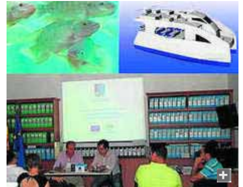
Consejo en Los Gallardos.

Dentro del 5º Consejo de Desarrollo Pesquero del Levante Almeriense, celebrado en Los Gallardos, destacaron principalmente por su inversión, innovación y carácter social varios proyectos. Entre ellos, la construcción y equipamiento de instalaciones para el de cultivo de 490 toneladas de tilapia. El proyecto cuenta con una inversión de 1.316.000 euros y un 42,70% de subvención.