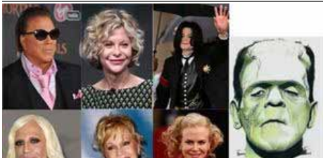
GRANDES DESTROZOS DE LOS FAMOSOS POR CULPA DE LA CIRUGÍA