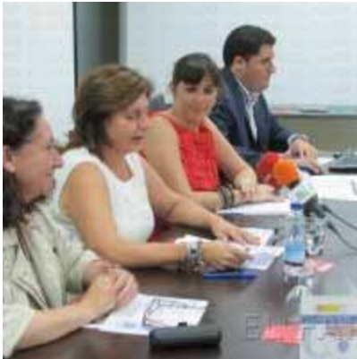
a. g. La jornada se celebró en la sede de la CECE.

La sede de la CECE acogió en la tarde de ayer una jornada sobre esta materia. La sede de la Confederación de Empresarios de Ceuta (CECE) acogió ayer la jornada llamada La igualdad en la empresa como estrategia de gestión, en la que se mostró la colaboración entre Ciudad y Estado para lograr el objetivo de conseguir la igualdad de oportunidades entre hombres y mujeres en las empresas.