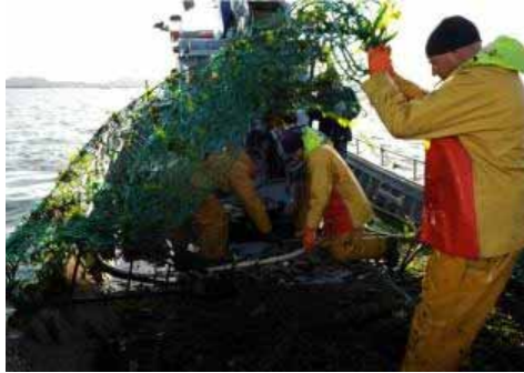
Los frutos de mar son un reclamo turístico.

Así, durante el mes de junio, especialmente los fines de semana, las empresas asociadas a este programa colaboran realizando menús y tapas para que los visitantes puedan degustar diferentes productos de mar y la cultura que se mueve a su alrededor. Para ello, también organizaron obradoiros gastronómicos y una feria marinera medieval, entre otros eventos. Para más información visitar www.margalaica.net o bien www.facebook.com/cometeomar .