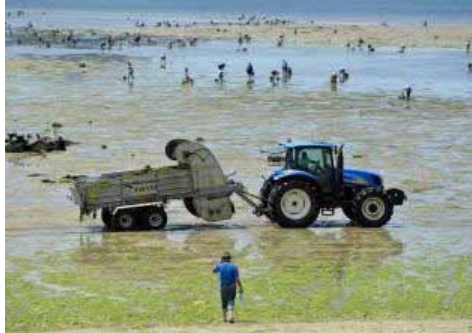
Una vista del banco de Lourido, con uno de los tractores de recogida de algas en primer término.

El regreso de las mariscadoras de la ría al banco de Lourido esta semana está teniendo como protagonista una anómala abundancia de algas para cuya retirada están trabajando los dos tractores de la lonja de Campelo. Desde el miércoles y hasta hoy, tal y como estaba planificado en el calendario de las cofradías, más de 220 trabajadoras están extrayendo moluscos del arenal. La inesperada plaga, superior a una presencia que suele aumentar con la llegada del verano , obliga a que se tengan que realizar primero tareas de limpieza en la zona para que se puedan realizar las de recogida de bivalvo.