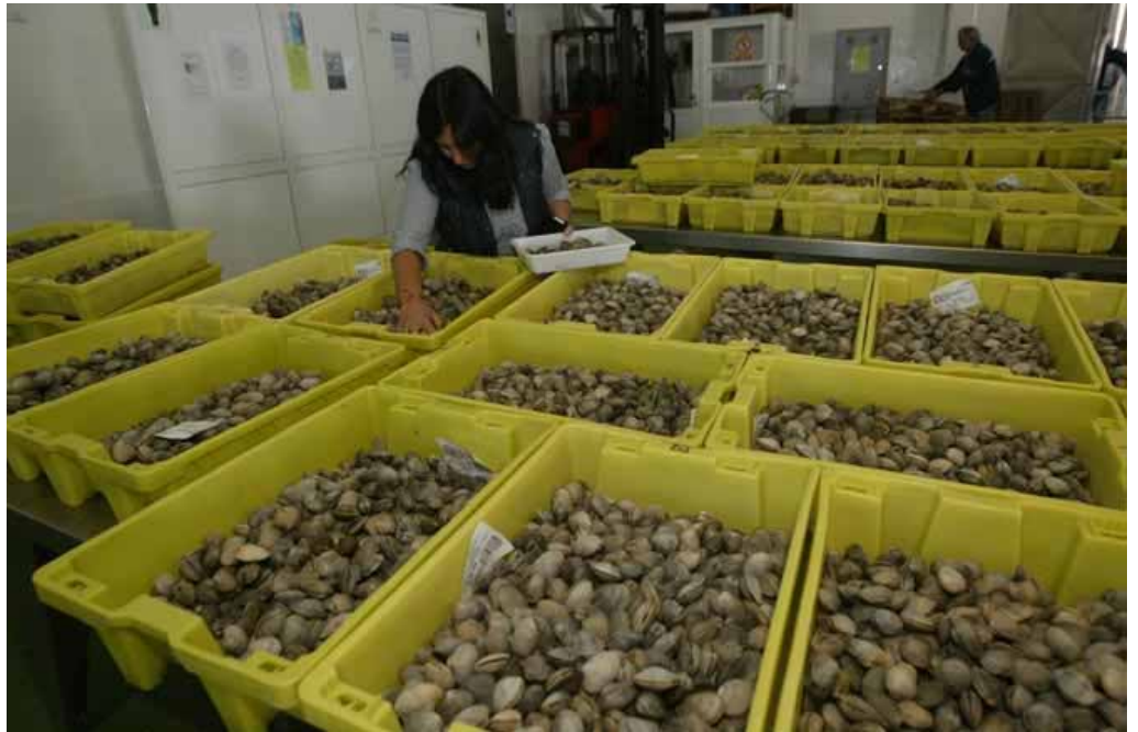
lotes de almeja en las subasta de una lonja arousana e.moldes

También las mariscadoras de Carril observan este descenso en la almeja, pero a su favor tienen el berberecho que en las últimas semanas les ha permitido equilibrar el jornal diario. Y es que ante la ausencia de babosa y la dificultad de encontrar en Os Lombos do Ulla almeja japónica, las mariscadoras cifran sus esperanzas en el recurso de los arenales.