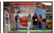
Padel en Adra