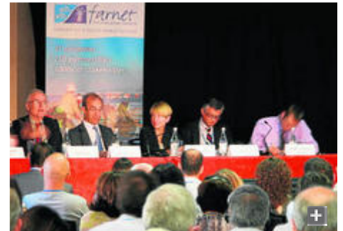
Isabelle Garzón (centro) de la Comisión Europea y miembros de la Farnet

Representantes de la Red Europea de Zonas de Pesca (Farnet, según sus siglas en inglés) han visitado la zona de pesca Almería Oriental. La Farnet agrupa a todas las zonas de pesca que reciben ayuda al amparo del Eje prioritario 4 del Fondo Europeo de Pesca (FEP). La Red tiene el propósito de ayudar a todas partes implicadas en el desarrollo sostenible de las zonas de pesca en los ámbitos local, regional, nacional y europeo.