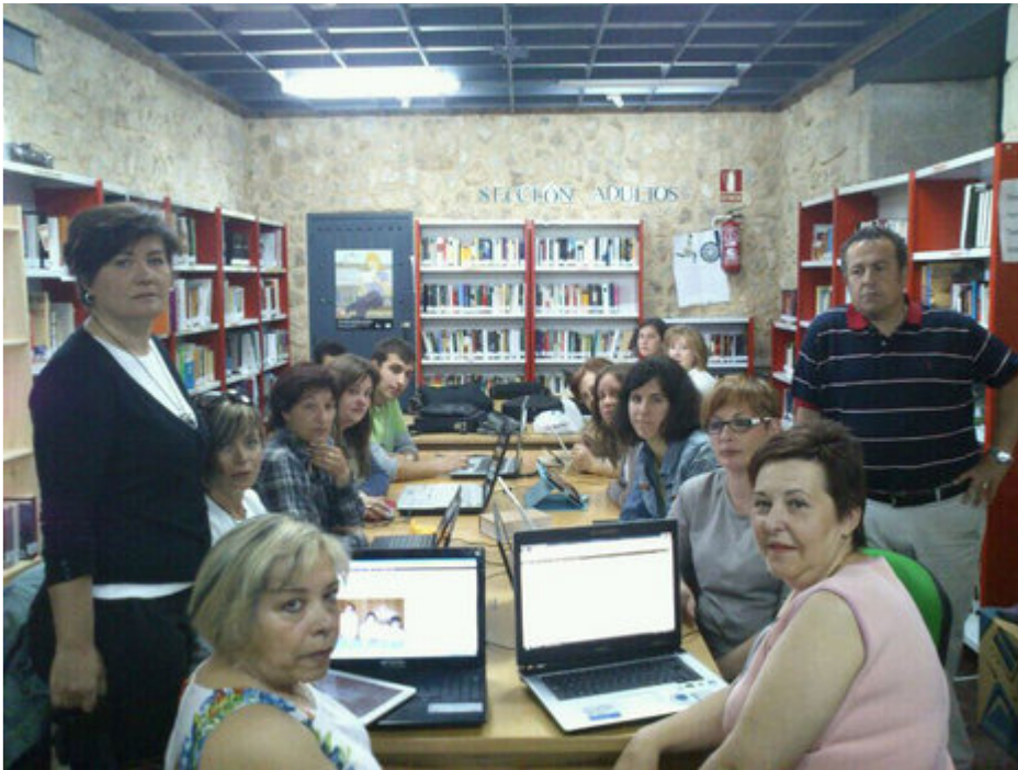
Actividad en AFAMMER.