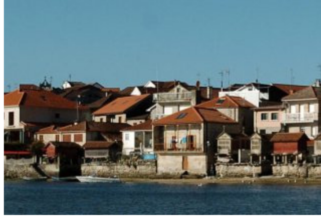
Fachada marítima de Combarro.

Poio aspira a convertir su patrimonio marítimo pesquero en un aliciente turístico que complemente a aquellos puntos más conocidos y turísticos. Para ello el grupo Acción Costeira Ría de Pontevedra mantiene en su programa de verano la organización de actividades que contribuyan a la divulgación de la importancia de un sector sin el que no se puede entender la historia ni la realidad del municipio.