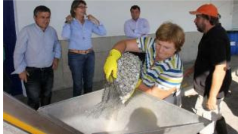
Las autoridades observan la trituradora de conchas.