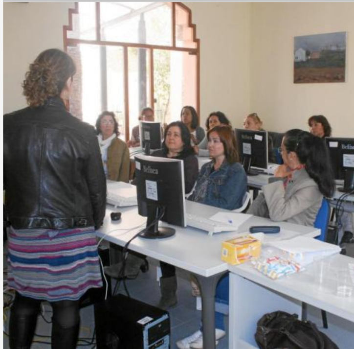
Un grupo de mujeres recibe asesoramiento para buscar trabajo

Bienestar Social impartió casi un centenar de talleres y más de 150 charlas informativas sobre equidad durante el primer semestre del año