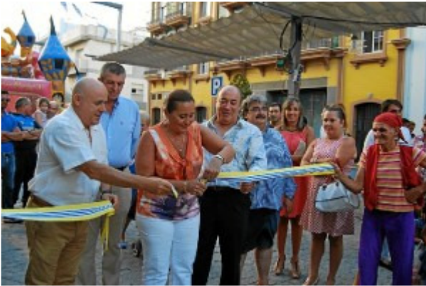
La alcaldesa corta la cinta inaugural.

agosto 2, 2013 | Filed under: A-Tema del día,Isla Cristina,Provincia,Sociedad | Posted by: redaccion2