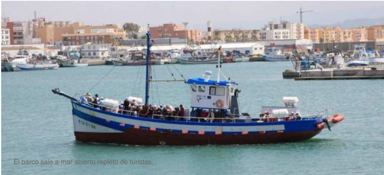
El barco sale a mar abierto repleto de turistas.