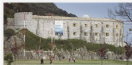
El Fuerte de San Martín es el lugar elegido para albergar la exposición sobre el mar y el sector conservero.

El objetivo, manifestó Leno, es que todo el mundo pueda sentirse reconocido en esta exposición. «Tanto los hombres como pescadores, que van a ver reflejada su actividad y se va a homenajear a los compañeros que perdieron su vida faenando, como las mujeres que han llevado siempre el peso de la industria conservera y se debe reconocer la importancia de su labor». El proyecto está financiado con fondos del Plan de Acciones Complementarias de la Secretaría de Estado de Turismo.