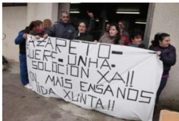
La semana pasada Lazareto se manifestó tres días seguidos en la lonja de Carril.

Después de una semana de descanso, Lazareto retomará mañana los actos de protesta y volverá a concentrarse en la lonja carrilexa coincidiendo con la llegada de las mariscadoras que faenan en la zona de los Lombos do Ulla, en Bamio. Los manifestantes acusan de "egoísmo" a las 46 mujeres en activo, que aseguran tratan de obstaculizar la incorporación de nuevos miembros y acaparar 1,2 millones de metros cuadrados de bancos.