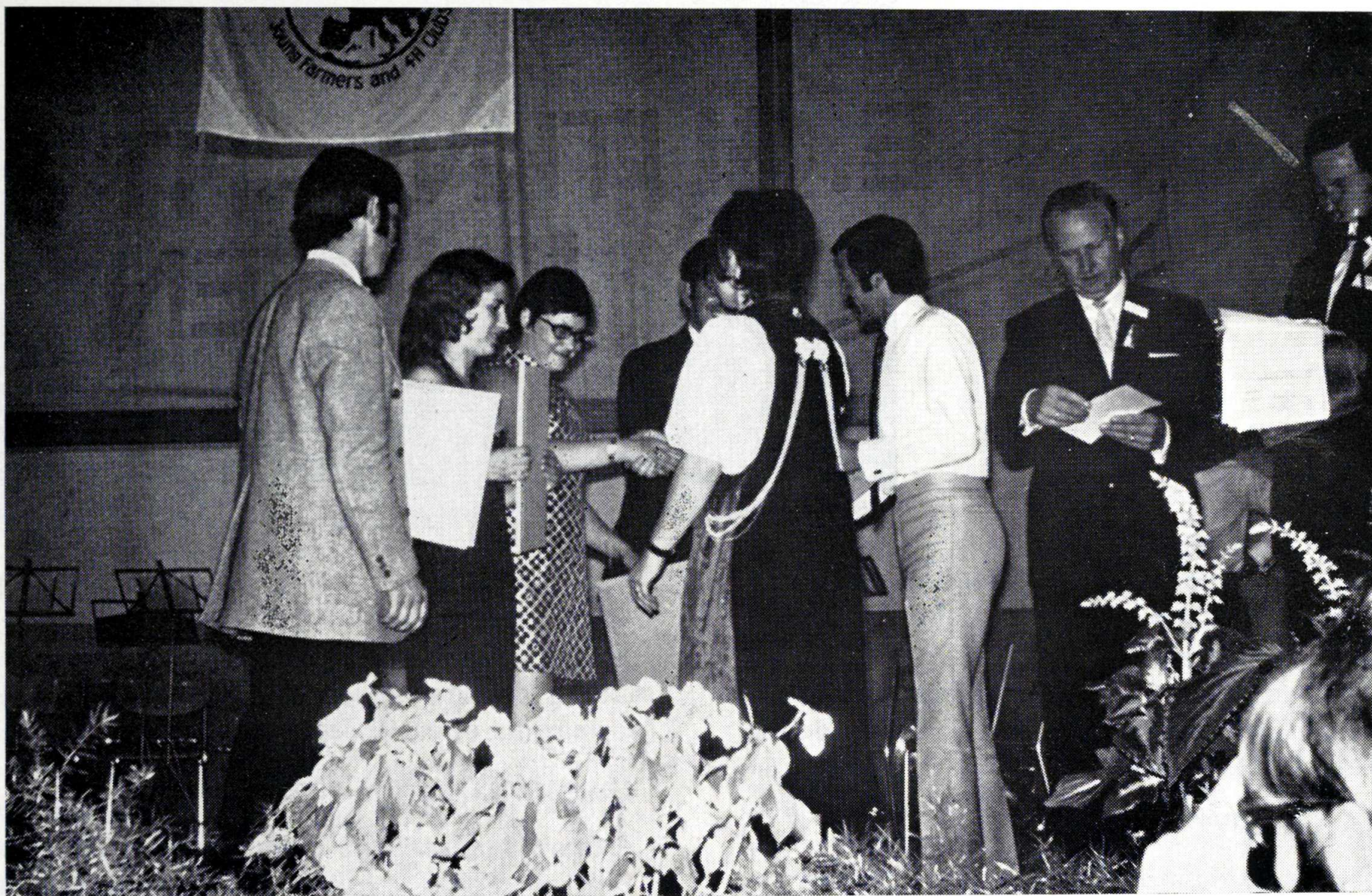
Acto de la entrega de los trofeos a los participantes españoles.