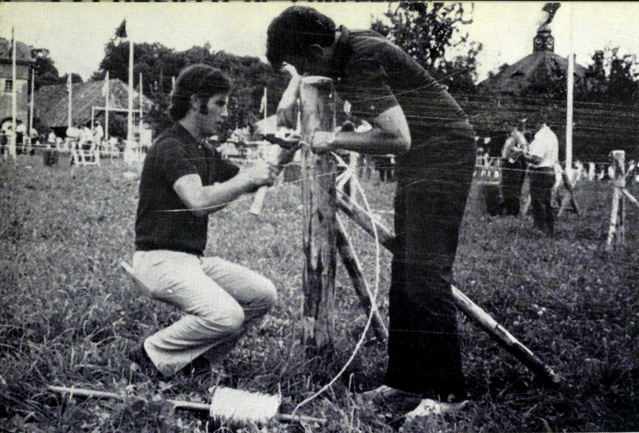
Desarrollo del concurso profesional de instalación de cercas para el ganado. En primer término, el equipo español en plena acción.

juventud rural asociadas al «Comité Europeo para los Jóvenes Agricultores y los Clubs 4-H», se dan cita en uno de aquellos países para mantener una serie de intensas jornadas de trabajo y convivencia.