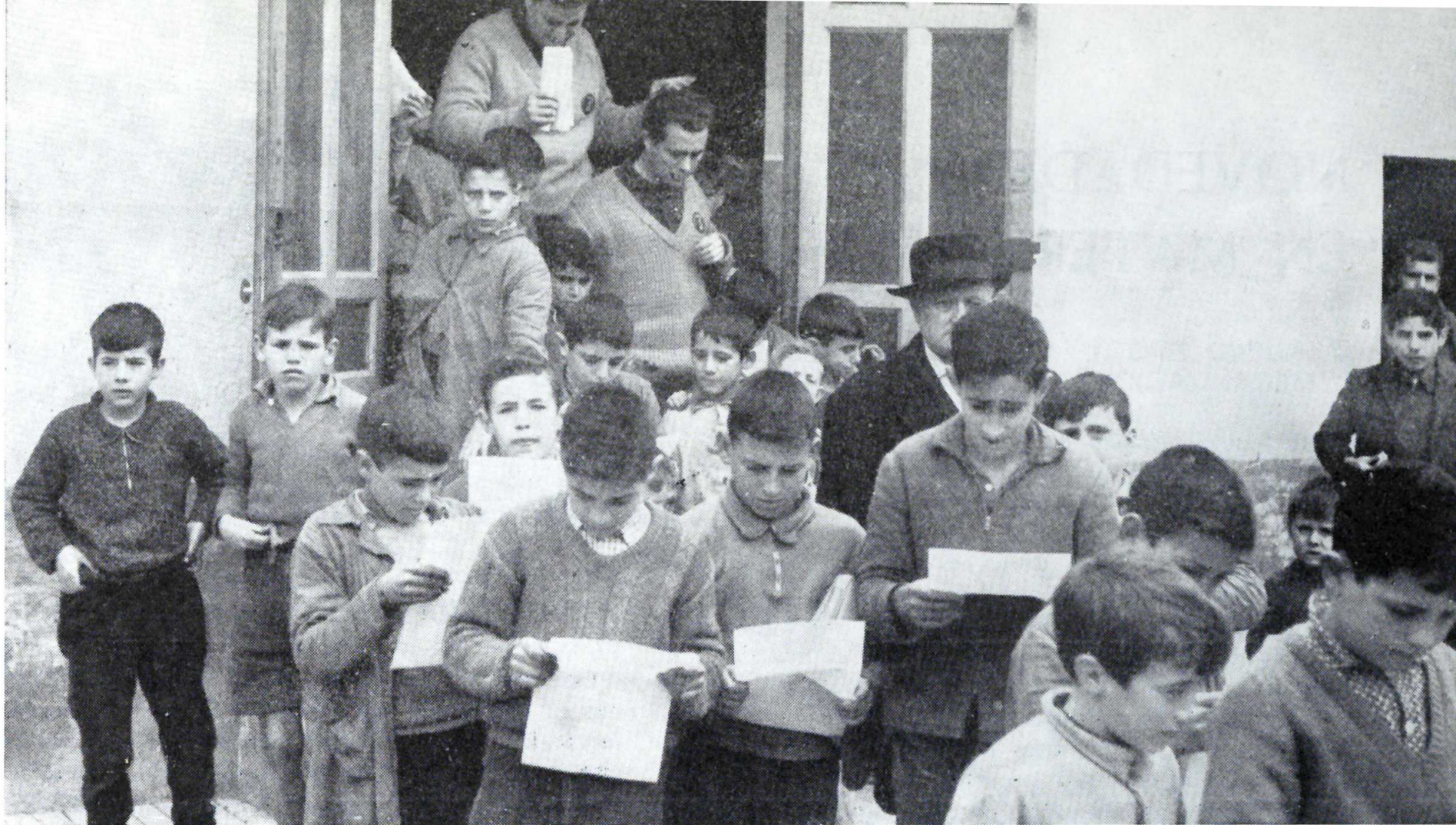
A la salida de una reunión.

1º En la fase de creación del Plantel , frecuentemente existe un desconocimiento inicial del grupo de jóvenes (aunque una parte de ellos sean conocidos individualmente); se sabe muy poco de los subgrupos en que se aglutinan, del nivel de relaciones que mantienen entre sí, de quienes ejercen una función destacada e influyente en el seno del grupo, etc. Todo lo anterior, sin embargo, es interesante conocerlo y tenerlo en cuenta para el planteamiento de las primeras actividades, sistema de funcionamiento a seguir, en definitiva, para conseguir un desarrollo adecuado del Plantel como grupo.