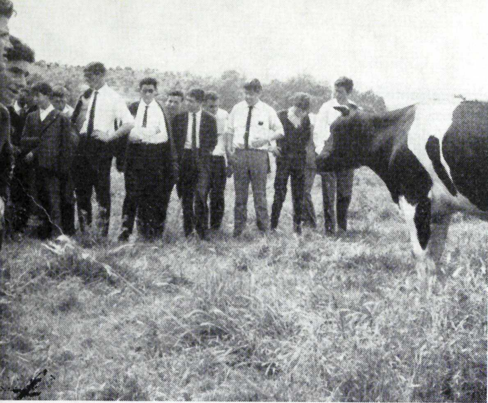
Los muchachos de un Plantel en una visita colectiva.