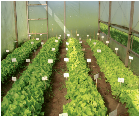
Figura 1. Ensayo de repelencia. Disposición de parcelas experimentales de lechuga mantecosa bajo cubierta

El cultivo de lechuga ( Lactuca sativa ) variedad "mantecosa" se llevó a cabo en un invernáculo de 32 m 2 durante los meses de mayo a setiembre, en surcos distanciados a 0.70 m sobre los que se delimitaron parcelas de 0.50 x 1.00 m, distribuidas al azar. (Fig. 1)