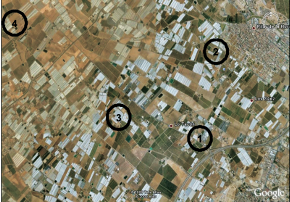
Figura 1. Fotografía aérea de los invernaderos seleccionados en el área de estudio. Los invernaderos seleccionados aparecen intercalados en el mosaico de cultivos tradicionales típico de esta zona agrícola del sureste español

radas entre sí por una distancia mínima de diez metros (confeccionando los gráficos a partir de los valores promedio), y una en el exterior. El muestreo se realizó de marzo a junio durante 2006 y 2009, correspondiendo con el periodo de máxima actividad de enemigos naturales en invernadero (SÁNCHEZ et al. , 2010), recogiendo las muestras semanalmente, y abarcado así dos ciclos de cultivo de pimiento.