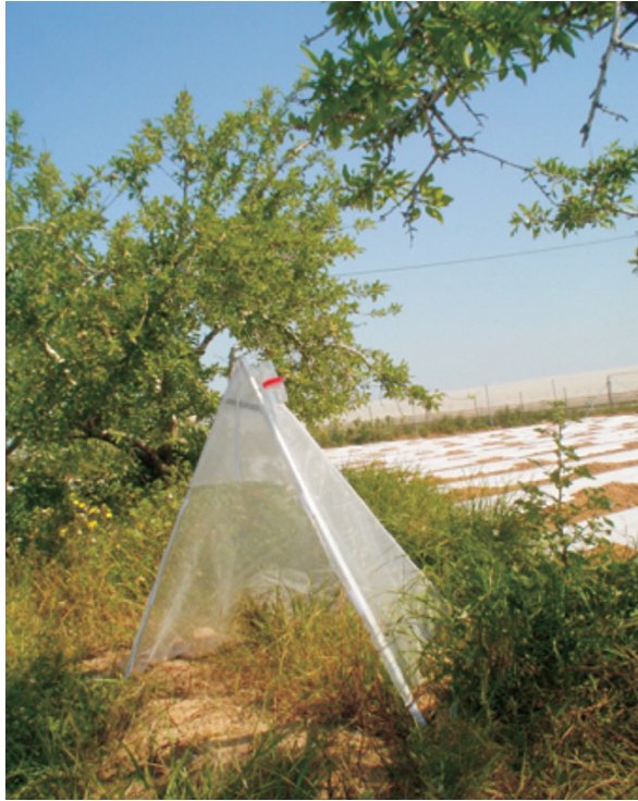
Figura 2. Trampa Malaise modificada situada en los cultivos de la periferia de los invernaderos estudiados.