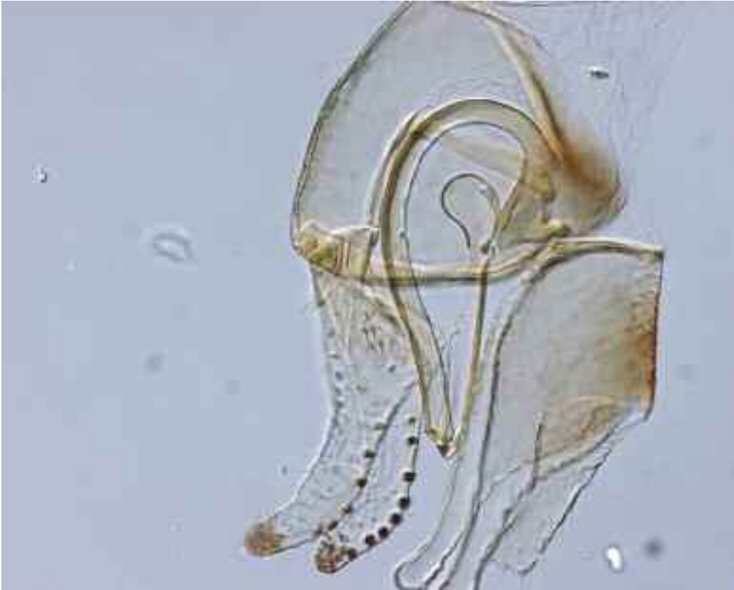
Figura 3. Genitalia del macho de Blastopsylla occidentalis

nando plantaciones de E. camaldulensis del área, determinó que el psílido se encuentra en el 90,5% de las fincas examinadas, y también en Portugal en la región del Algarve. Las poblaciones encontradas no han sido muy elevadas, y además es difícil de detectar por coexistir con las poblaciones de Glycaspis brimblecombei , cuya presencia es mucho más aparente. En cualquier caso, se piensa que su introducción debe de haber sido reciente, dado que en ningún caso apareció una densidad alta de insectos. Las mayores densidades poblaciones encontradas correspondieron a los meses de primavera, y ya en verano, al menos en las condiciones de la provincia de Huelva, parece casi desaparecer totalmente. Finalmente, hasta el mo-