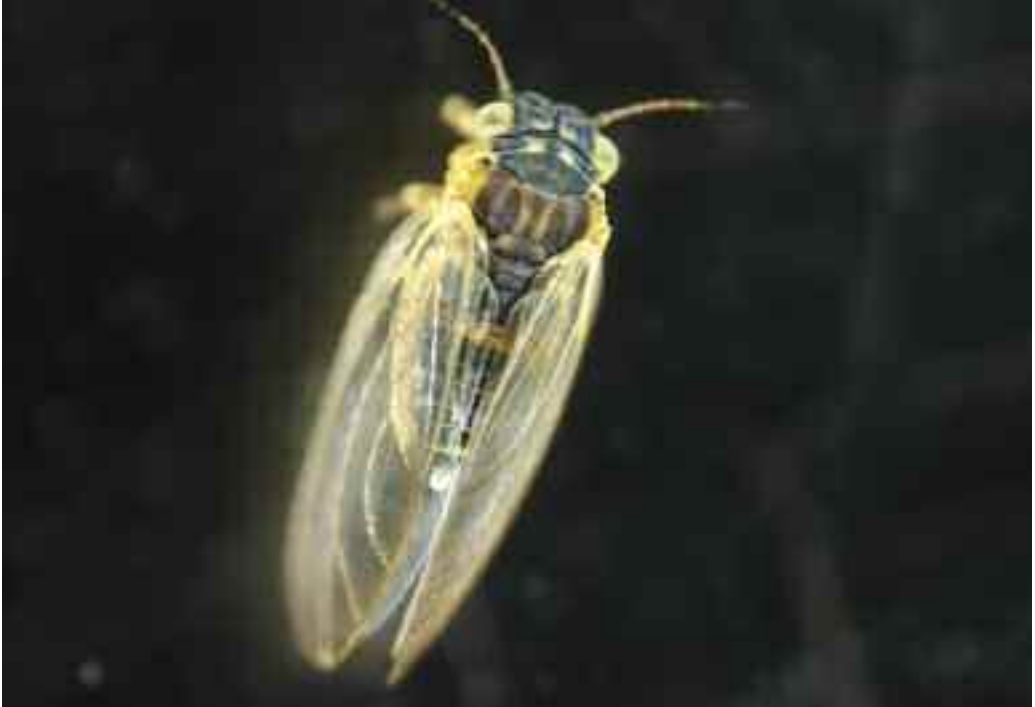
Figura 1. Vista dorsal de la hembra de Blastopsylla occidentalis

Los adultos son insectos de entre 1,7 y 2,5 mm de longitud (normalmente las hembras son más grandes que los machos). Cuando nacen, son amarillentos pero después se van oscureciendo, apareciendo bandas oscuras en los terguitos; existe cierto dimorfismo sexual en el sentido de que las hembras suelen ser más oscuras, de tintes amarillentos. La cabeza, tan ancha como el tórax y de vértex cuadrangular dividido en dos partes por una línea negra, aparece fuertemente inclinada con relación al eje longitudinal del cuerpo. Frente a Glycaspis brimblecombei , los conos genales en B. occidentalis son cortos. Las antenas presentan 10 artejos, como las demás especies del género; son de color marrón con los dos últimos artejos más oscuros. Las alas, de color ceniciento, presentan los nervios marrón oscuro, y son redondeadas apicalmente. Las patas son cortas y robustas, y en las metacoxas no