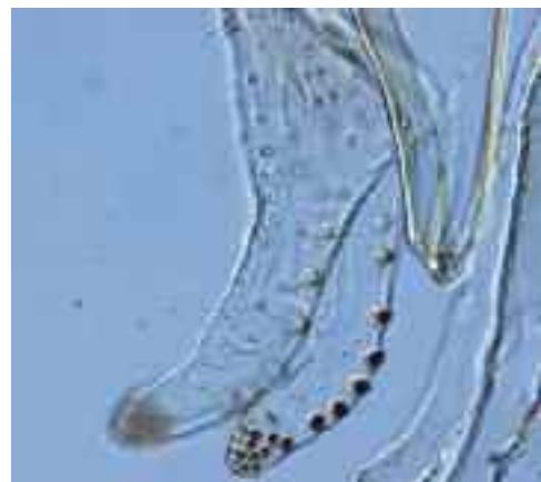
Figura 4. Detalle de los parámetros de la genitalia masculina de Blastopsylla occidentalis

nando plantaciones de E. camaldulensis del área, determinó que el psílido se encuentra en el 90,5% de las fincas examinadas, y también en Portugal en la región del Algarve. Las poblaciones encontradas no han sido muy elevadas, y además es difícil de detectar por coexistir con las poblaciones de Glycaspis brimblecombei , cuya presencia es mucho más aparente. En cualquier caso, se piensa que su introducción debe de haber sido reciente, dado que en ningún caso apareció una densidad alta de insectos. Las mayores densidades poblaciones encontradas correspondieron a los meses de primavera, y ya en verano, al menos en las condiciones de la provincia de Huelva, parece casi desaparecer totalmente. Finalmente, hasta el mo-