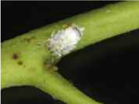
Figura 2. Ninfa de Blastopsylla occidentalis

Las hembras de B. occidentalis realizan la puesta en los brotes y hojas jóvenes, en las axilas de las hojas y en los ramillos. Los estados ninfales segregan gran cantidad de cera que se deposita sobre la superficie de su cuerpo así como filamentos cerosos que los recubren. También secretan melaza en abundancia, que a veces permanece adherida en forma de gotas al final del abdomen.