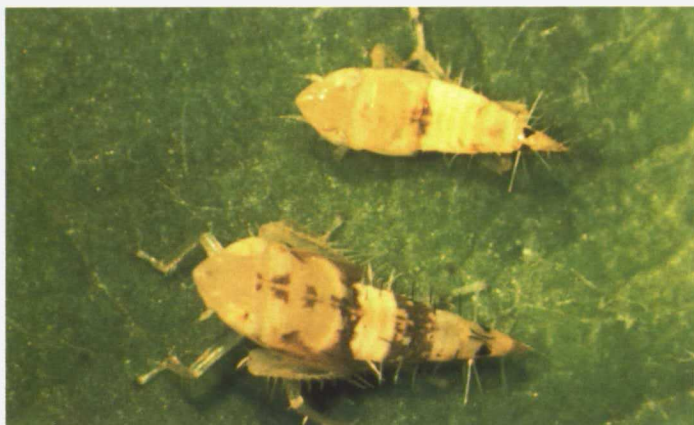
Larvas de 4º y 5º estadio de Scaphoideus titanus.