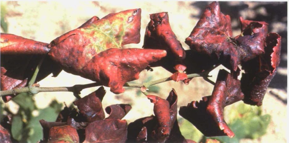
Detalle de las hojas.