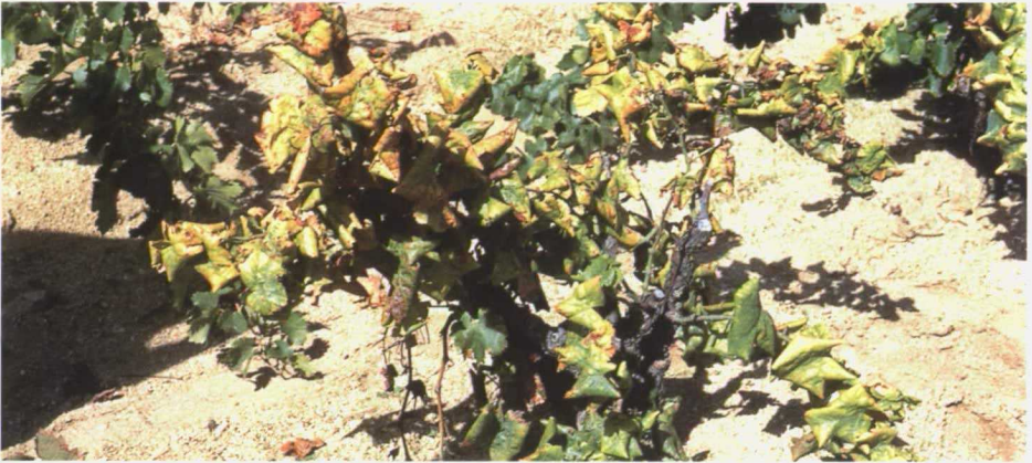
Cepa de variedad blanca afectada.