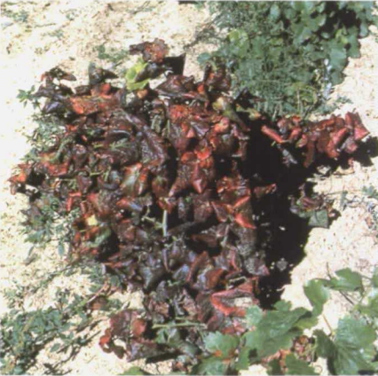
Cepa de variedad tinta afectada.