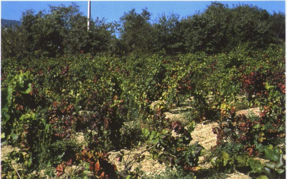
Viña afectada por Flavescencia dorada.