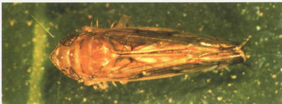
Adulto de Scaphoideus titanus.

Ante cualquier sospecha de la enfermedad, avisar a los Servicios Oficiales competentes.