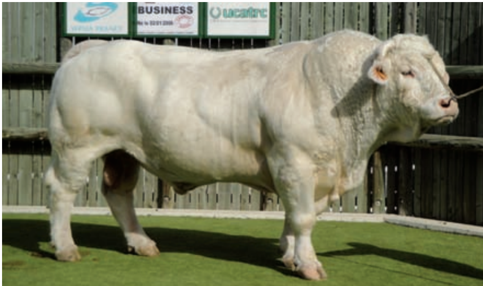
Foto 3. Toro del centro de inseminación.

Genealógico (1.500 ganaderos). Se trata sin duda de una raza en expansión con un aumento anual del censo de un 5% que además se está implantando en América Latina y otros países de Europa. La selección de los últimos 40 años ha mejorado de forma sustancial los rendimientos de esta raza a la vez que ha sabido conservar la terneza de su carne y sus características funcionales (aplomos correctos con un esqueleto fino que de media representa un 9,62% sobre el peso de la canal). A modo de curiosidad, se puede señalar que el record del mundo en peso canal de una hembra lo ostenta una vaca Blonde d'Aquitaine de 8 años sacrificada el día 5 de septiembre de 2009. ¡Su canal pesó 904,5 kg (rendimiento: 64,3%)!