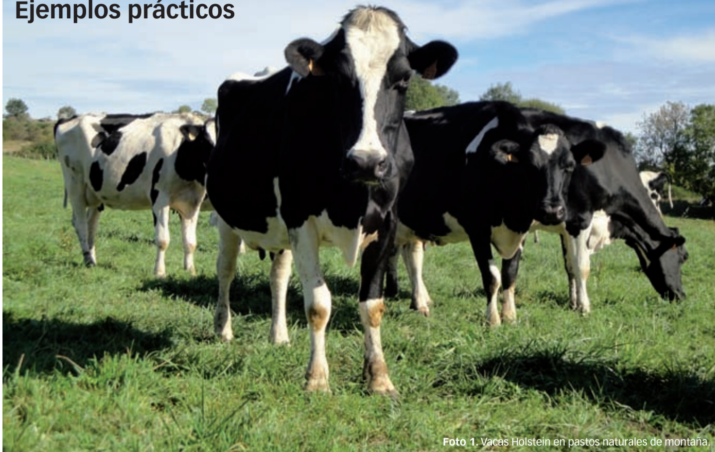
Foto 1. Vacas Holstein en pastos naturales de montaña.

Con ocasión de la celebración del Sommet de l'Élevage en Clermont Ferrand (Francia), MG ha tenido la ocasión de conocer en primera persona algunas explotaciones típicas de ganado vacuno en este país.