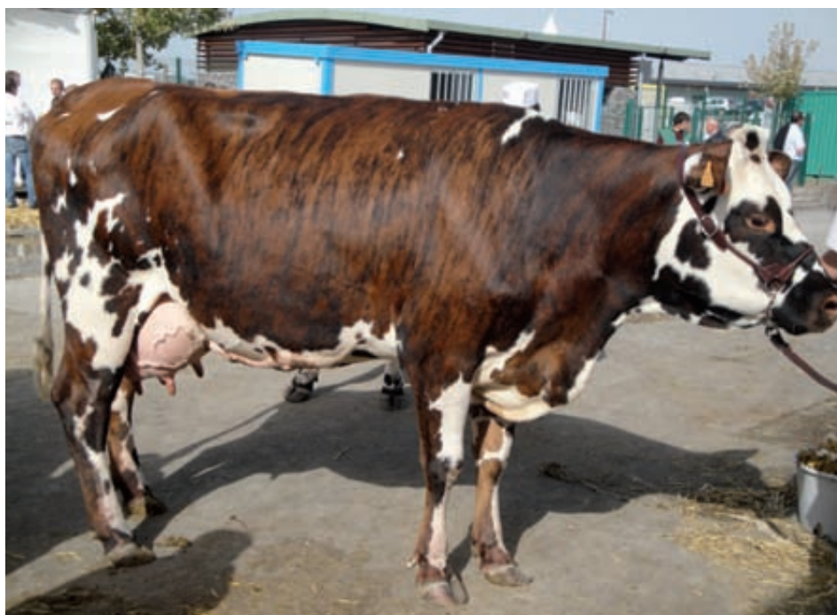
Foto 2. Vaca Normande.

tros de leche), tres empleados y 280 ha de pastos (de 950 a 1300 m de altitud en zona granítica). La explotación se enmarca en la denominación de origen (DO) del queso Saint-Nectaire y como tal tiene que ceñirse a unas reglas. Las vacas pastan durante al menos 145 días en época estival (Foto 1; el resto del año están en estabulación libre con cubículos de hormigón cubiertos de paja) pero se recogen diariamente para los dos ordeños. De lunes a sábado, tanto la leche de la mañana como la leche de la tarde son directamente transformadas en queso mientras que la leche de los domingos es vendida a una central lechera. El rendimiento quesero varía a lo largo del año en función de la alimentación de las vacas pero se sitúa entre 12 y 14 litros de leche por kg de queso. El queso se elabora con 30 ml de cuajo por 100 litros de leche (30 min de coagulación), permanece entre 48 horas y siete días en la explotación y después se vende a otra persona que se encarga de su curación. Se considera que el queso Saint-Nectaire está curado al cabo de cuatro semanas tras su venta por el ganadero. La producción diaria de queso también oscila durante el año entre las 160 y las 220 piezas. En cualquier caso, la DO limita a 86 toneladas la producción anual de queso por una misma explotación.