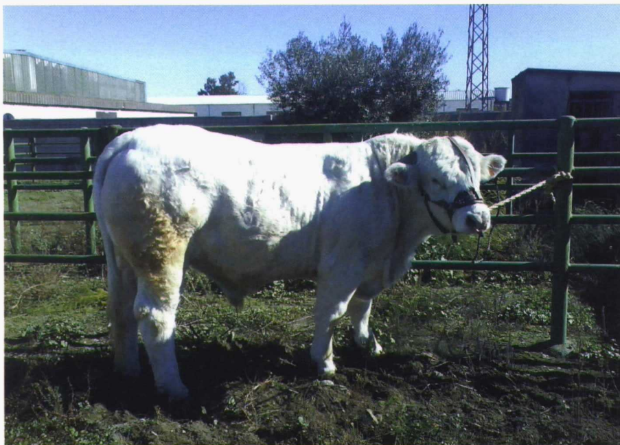
Foto 2. Semental cárnico destinado a cruce industrial.