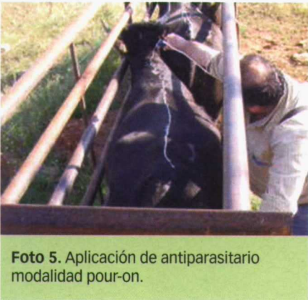
Foto 5. Aplicación de antiparasitario modalidad pour-on.

genes resistentes y a la intensidad de la presión selectiva, que determinará la supervivencia de parásitos resistentes.