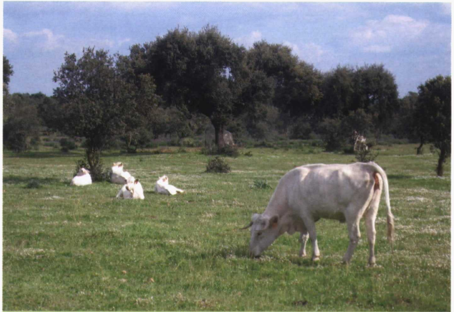
Foto 1. Blanca Cacerreña en la dehesa.

De aplicación sobre animales sin signos de enfermedad, pero con riesgo potencial de contraerlas, ellos o su descendencia. Por ejemplo, el tratamiento de terneros destetados que inician la temporada de pastoreo frente a nematodos gastrointestinales con productos de efi-