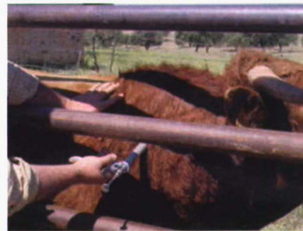
Foto 3. Aplicación parenteral de antiparasitarios.