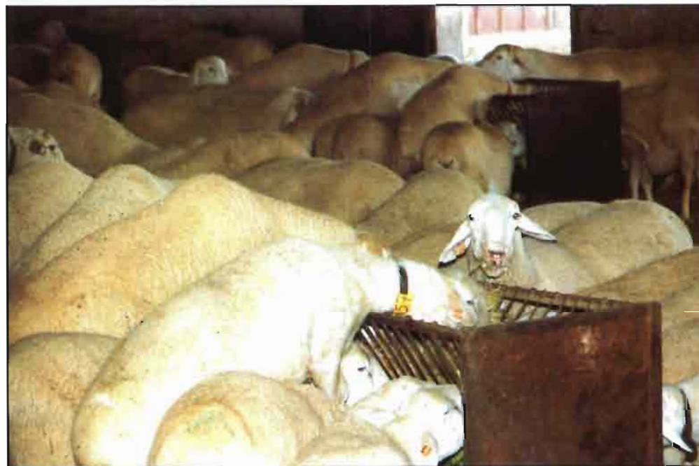
Se siguen recomendando unos aportes nutritivos superiores a las necesidades.

Como consecuencia de esto, existe una importante estacionalidad de la producción de leche a lo largo del año, centrándose el grueso de ésta entre los meses de marzo a junio/julio, lo cual tiene una enorme reper-