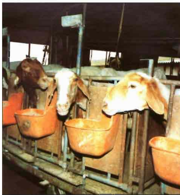
Se hace aconsejable la organización del rebaño por lotes.

La CC de la oveja en el período de cubrición tiene un efecto altamente significativo sobre la fertilidad y la prolificidad (Robinson, 1983; Hinch y Roelofs, 1986;