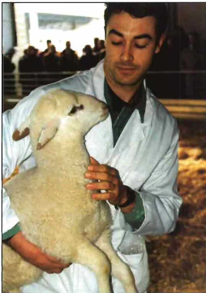
En la cría de las corderas se distinguen dos subfases.

La ecuación de normalización del contenido en grasa de la leche utilizada es la siguiente: