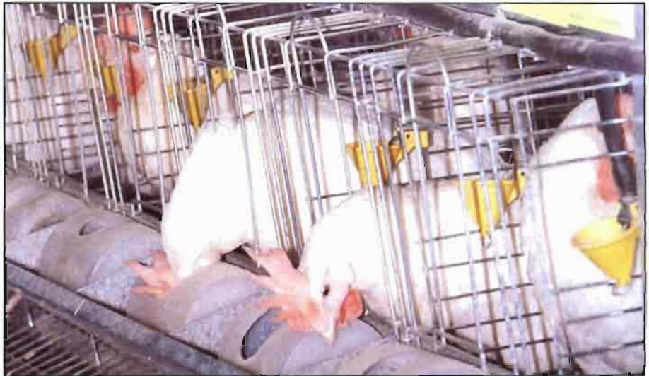
Las necesidades de calcio de las ponedoras han aumentado con el paso de los años.

Resulta difícil establecer con exactitud las necesidades de calcio (Ca) de las ponedoras, pues distintos factores influyen sobre las mismas (estirpe de las aves, interrelación con otros nutrientes —sobre todo, con el fósforo y con la vitamina D 3 —, interrelación entre solubilidad de la fuente de Ca y disponibilidad del Ca, etc.). Lo que sí está claro es que dichas necesidades han aumentado con el paso de los años, a la vez que ha sido continuamente mejorada la capacidad productiva de las gallinas. Esto queda reflejado en las recomendaciones del National Research Council (NRC) en sus