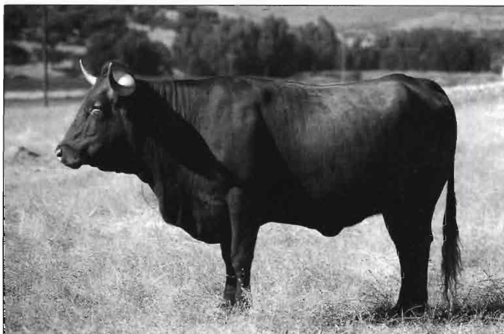
En tres provincias, Córdoba, Cádiz y Sevilla, se concentra casi el 74% del vacuno andaluz.