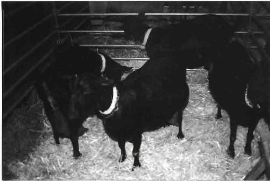
La cabaña caprina andaluza supone una tercera parte de los efectivos nacionales.

carne (16% del total) así como de leche (44%) de la especie caprina, siendo el vacuno el productor nato de leche.