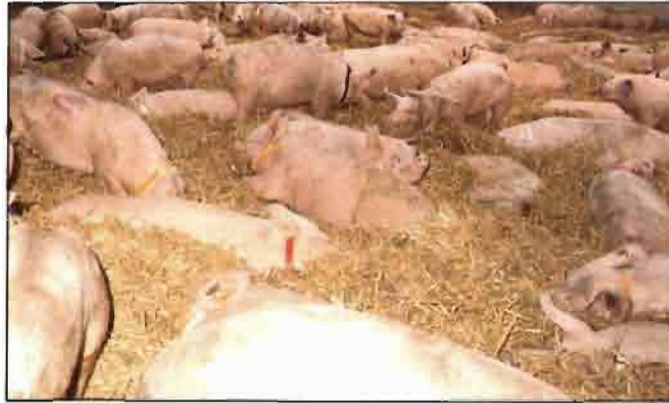
En España existen hoy unos 17 millones de cabezas porcinas.

mentales y amenaza la unidad económica y monetaria de la CEE).