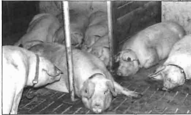
Entre los principales problemas del sector porcino se destacan los de contaminación y eliminación de deyecciones.

porcino en particular, entre un importante universo del discurso de los consumidores comunitarios. En efecto, para un sector importante de los consumidores comunitarios, la carne (y, en especial, la de porcino) no tiene una "aceptación positiva". La grasa, por ejemplo, especialmente la de cobertura, es rechazada por su alto contenido energético (de ahí el objetivo inicial de mejorar la proporción de magro de las medias canales).